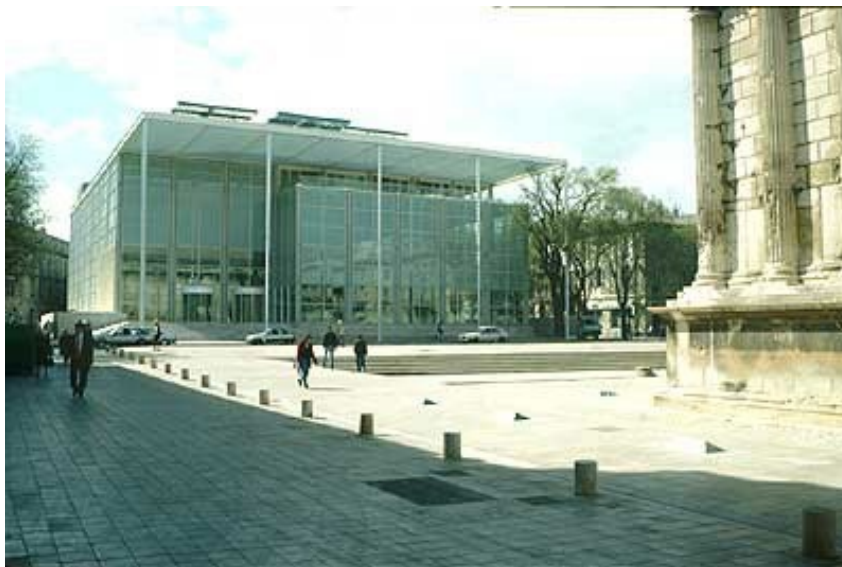
Figure 4 : Le Carré d'Art, médiathèque de Nîmes. Architecte : N. Foster