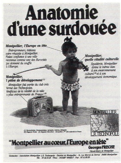
Figure 1 : Encart publicitaire de la ville de Montpellier

Quand Georges Frêche (diplômé d'HEC et juriste) est arrivé en 1977 à la mairie de Montpellier avec l'étiquette du Parti Socialiste, il a fait de sa ville l'une des premières de France à se lancer dans le marketing et la communication urbaine. Dans le cadre d'un contrat pluri-annuel d'amélioration de l'image de la ville, conclu par la municipalité Frêche avec le cabinet RSCG, c'est un déplacement des thèmes porteurs de l'image de la ville qui est recherché : Montpellier n'est pas seulement une ville du midi, ensoleillée et propice au farniente, mais c'est une ville de pointe en matière de technologie et d'enseignement supérieur. C'est en tous cas ce que signifient les slogans successifs "Montpellier l'entrepreneante" puis "Montpellier la surdouée" qui accompagnent la mise en place d'un technopôle organisé en 5 sites thématiques 3 dans la périphérie de la ville.