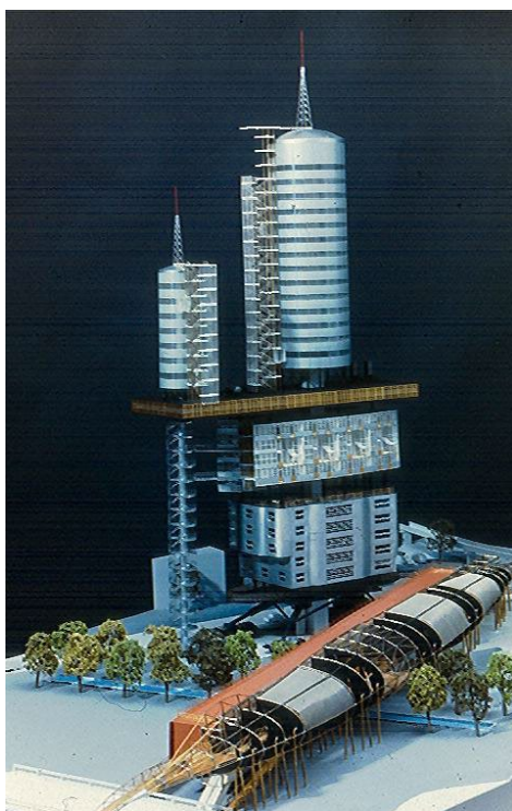
Figure 6 : La maquette de la Tour Européenne, Hérouville Saint-Clair.

Architectes : J. Nouvel, M. Fuksas, O. Steidle, W. Alsop