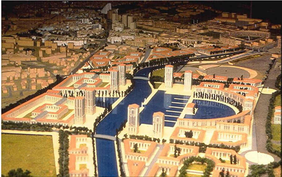
Figure 2 : Port-Marianne (Montpellier). Architecte-coordonateur : R. Bofill

2001). Nous voudrions seulement montrer ici comment, dès l'amont des opérations, les impératifs de communication-médiatisation sont pris en compte, en termes programmatiques.