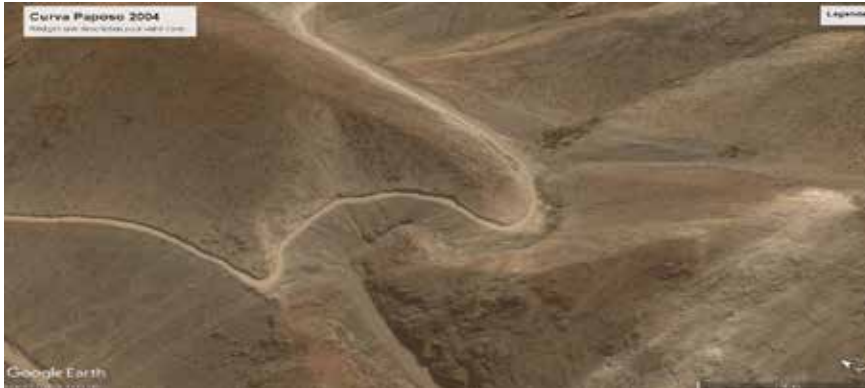
Figura 9. Curva de Paposo en 2004, según trazado original de 1870.

La penúltima curva de Paposo. Agentividad técnica... NICOLAS RICHARD, DIEGO ORTÚZAR