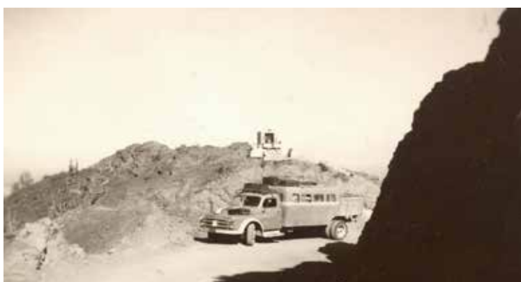
Figura 8. Curva de Paposo. Colectivo Taltal-Antofagasta, circa 1950.