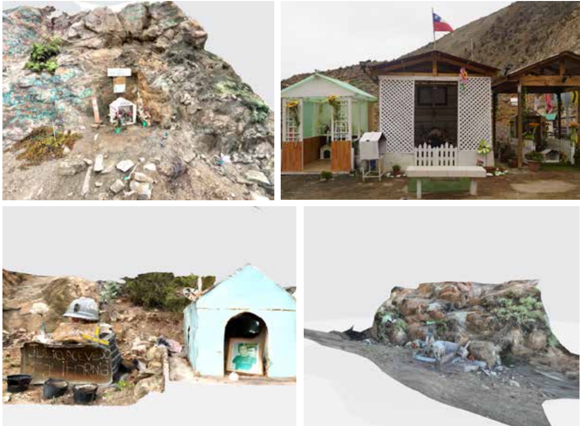
Figura 15. Animita de la familia Castillo García (2019), memorial oficial a las víctimas del accidente Tur Bus (2019), Animita de Julio Acevedo (2019), Animita al accidente de Pullman Bus (2013). Fuente: Richard (2023h, 2023i); Richard y Hernández (2023b, 2023c).

La penúltima curva de Paposo. Agentividad técnica... NICOLAS RICHARD, DIEGO ORTÚZAR