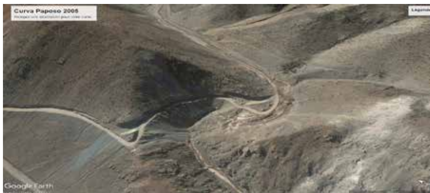
Figura 10: Curva de Paposo en 2005, durante las obras del Cuerpo Militar del Trabajo.