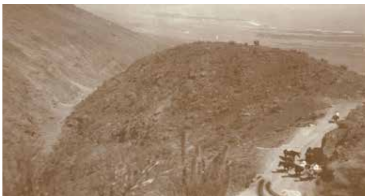
Figura 7. Curva de Paposo hacia 1920.