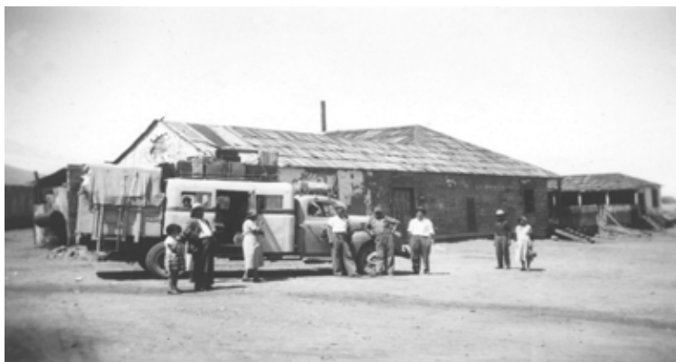
Figura 5. Camión en Paposo. Colectivo Taltal-Antofagasta, circa 1950.