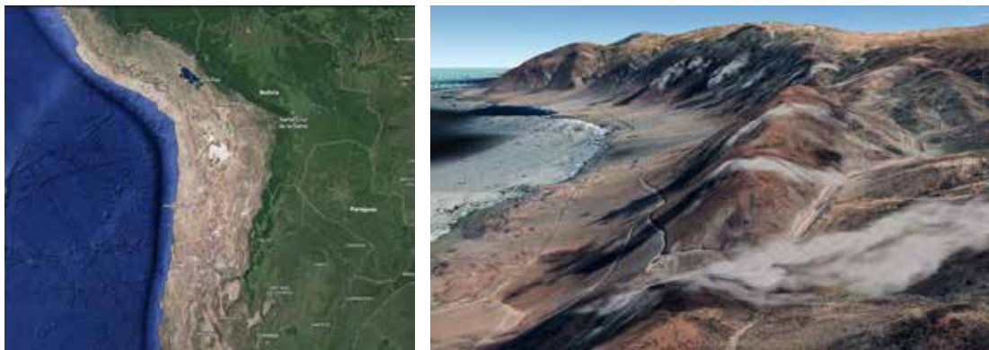
Figura 1. Región de Antofagasta, Chile, y ruta B-710 en tramo farellón costero.

Esta obra de gran importancia ha logrado revitalizar económicamente una zona hasta entonces fuertemente deprimida y reducir en casi un tercio el tiempo de viaje entre Taltal y la capital regional. No obstante, desde su asfaltado, esta carretera ha sido el escenario trágico de múltiples accidentes mortales, especialmente volcamientos de camiones o autobuses, sobre todo en la penúltima curva de la cuesta, tras treinta kilómetros de descenso, casi llegando al mar. Desde su inauguración en 2010, según registros oficiales, 34 personas han perdido la vida en 43 accidentes en la cuesta de Paposo. En la medida en que las estadísticas policiales solo apuntan una dirección manuscrita y que, en este tipo de carretera rural más bien periférica, la granularidad de la información disponible es extremadamente gruesa, no se dispone de estadísticas específicas sobre la penúltima curva de Paposo, que tampoco figura entre los llamados “puntos críticos” de siniestralidad vial (CONASET, 2023). Sin embargo, a pesar de la falta de datos administrativos, esta curva ha adquirido una notoria reputación como el tramo más peligroso en la nueva carretera costera, y varios elementos respaldan esta afirmación. Por un lado, la observación in situ de las animitas, oratorios y monumentos