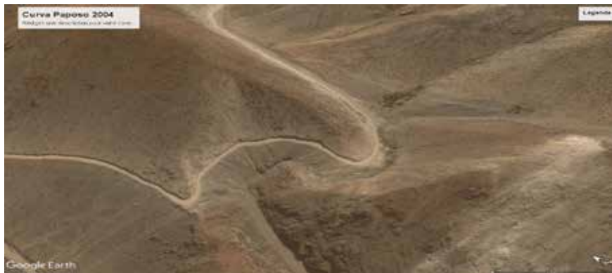
Figura 9. Curva de Paposo en 2004, según trazado original de 1870.

La penúltima curva de Paposo. Agentividad técnica... NICOLAS RICHARD, DIEGO ORTÚZAR