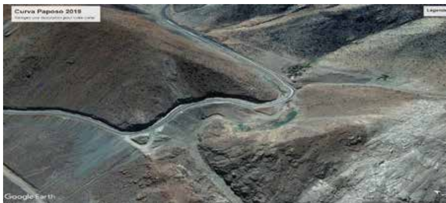
Figura 12. Curva de Paposo en 2019.