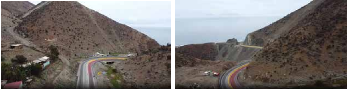
Figura 2. Capturas de video aéreo sobre curvas finales de la Cuesta Paposo. A la izquierda la penúltima. Fuente: Richard (2023). Video consultable en plataforma Nakala de Huma-Num: https://nakala.fr/10.34847/nkl.36d190y6

La penúltima curva de Paposo. Agentividad técnica... NICOLAS RICHARD, DIEGO ORTÚZAR