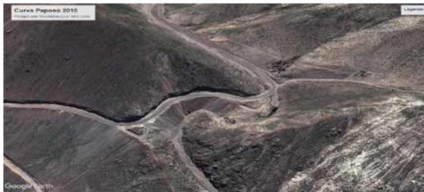
Figura 11. Curva de Paposo en 2010, al momento de la inauguración de la ruta asfaltada.