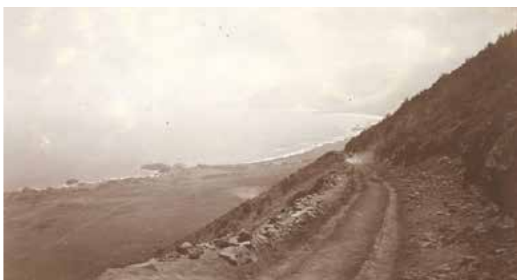
Figura 6. Cuesta Paposo hacia 1920.