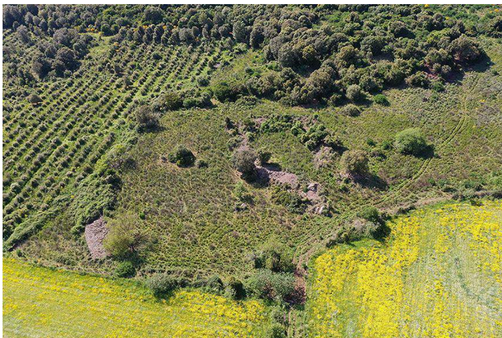
Fig. 4. Vue aérienne des ruines antiques en forme de fer à cheval, à Grugua.