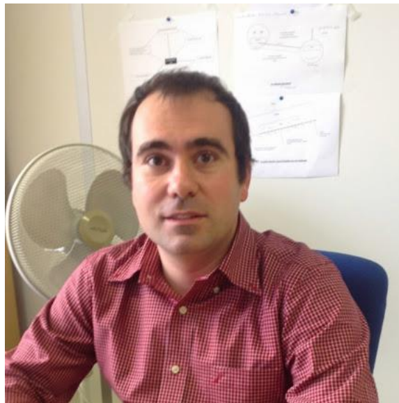
Photographie de l'auteur en responsable de formations, 2013

Portrait d'un travailleur en chemise rouge, surpris devant son ordinateur de bureau, en pleine ingénierie de formation. Le ventilateur, orienté vers la tête de l'employé, est la marque estivale de l'immeuble, dans une industrie de l'éducation en fonctionnement normal : sans climatisation, mais avec une badgeuse pour compter les heures de présence. Les croquis à l'arrière-plan sur le mur sont des idées nocturnes, ou de jours fériés, sur la profession de ces années-là, dessinés pour le laboratoire des Arts et Métiers et repris dans les colloques, les documents scientifiques et les cours universitaires :