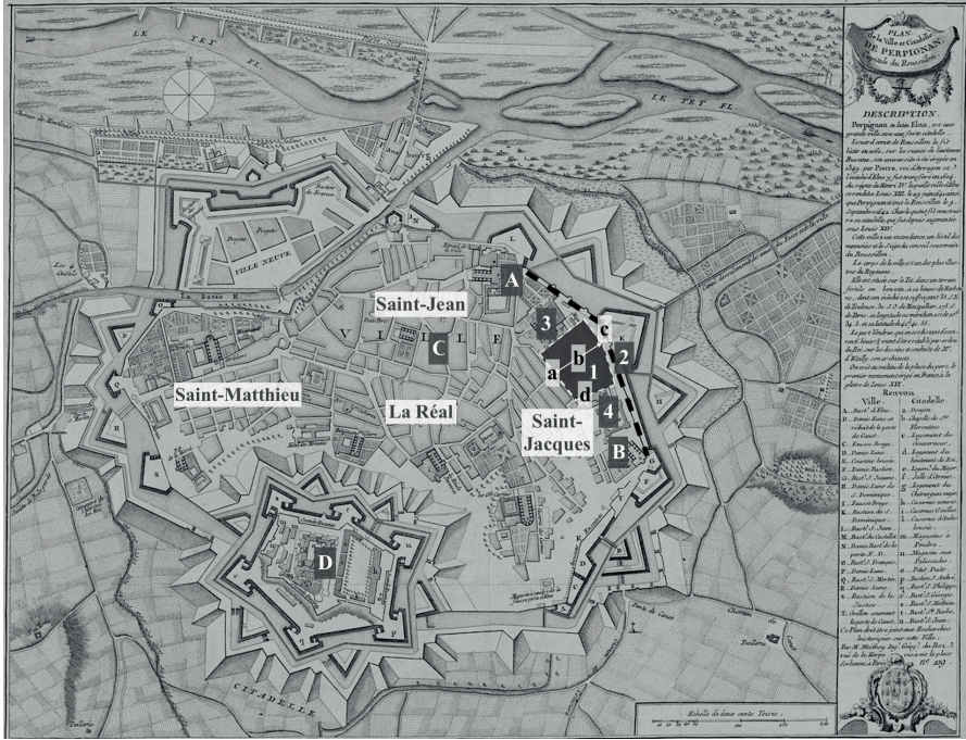
Figure 1 – Emplacement du call de Perpignan (fin XIII e -fin XV e siècle), reconstitué à partir d'un plan de la ville datant de la fin du XVIII e siècle.

Légende : (1) emprise du call , (2) troisième rempart du XIII e siècle, (3) couvent dominicain, (4) place du Puig , (a) porte principale du call , (b) rue (principale) du call , (c) Portalet dels Juheus , (d) porte d'en Nathan (XV e siècle), (A) église Saint-Jean, (B) église Saint-Jacques, (C) plaça de les Corts , (D) château royal.