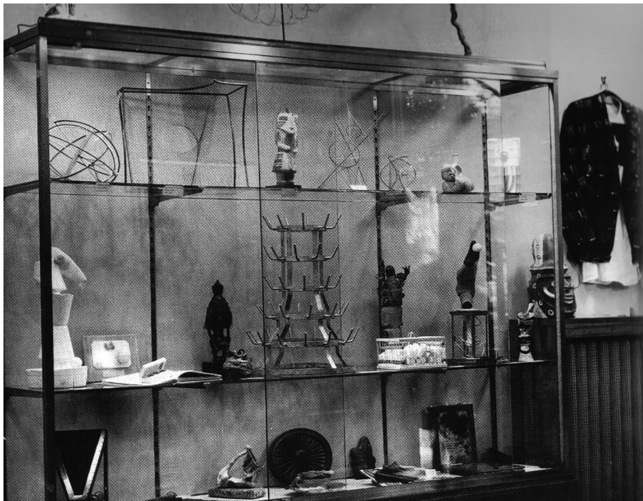
6 Vue de L'« exposition Surréaliste d'objets », Galerie Charles Ratton, Paris, 22-29 Mai 1936, Photographie de Man Ray

perspective, l'action de juxtaposer ou de faire voisiner, dans un même espace, des objets de nature éloignée était jugée propice à faire émerger leur pouvoir évocateur, et ainsi à provoquer un effet de surprise et des émotions inattendues.