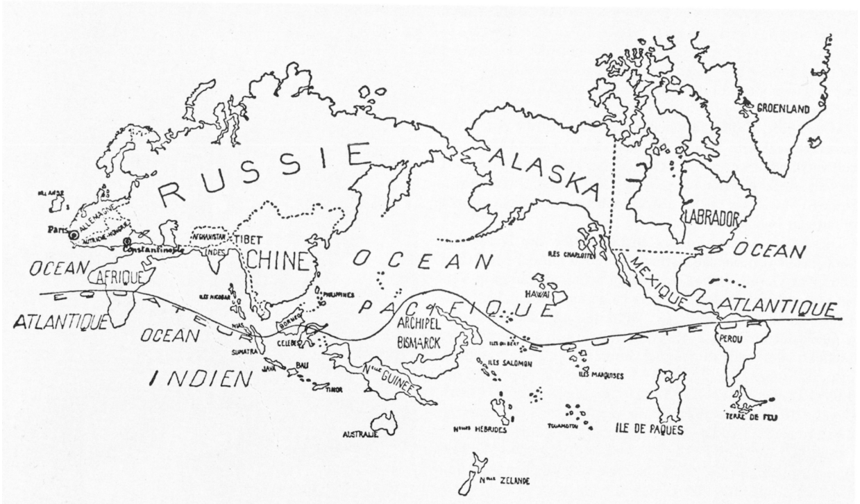
1 Anonyme, Le Monde au temps des Surréalistes , publiée dans la revue Variétés en juin 1929

identifié un univers mental susceptible de nourrir leur projet intellectuel et artistique fondé sur la recherche d'une énergie créatrice nourrie par la libre expression de l'inconscient et l'activité onirique, ce qui était pour eux une des voies pour « faire rempart au rationalisme occidental » 5 . C'est à travers la matérialité des objets « exotiques » qu'ils pensaient pouvoir accéder aux modes de pensée des peuples non-occidentaux. Comme le souligne Amy Winter (2008) : « Les surréalistes ont reconnu dans les arts autochtones une aura ; ils enviaient le type de société que ces peuples partageaient, et se sont mis en quête de ces objets à des fins artistiques, [mais aussi] pour les sauver des ruines de la modernité » 6 . Ainsi, les objets créés par les peuples d'Amérique du Nord étaient considérés comme l'expression tangible d'une vision du monde qui les séduisait. L'acquisition d'objets provenant de ces sociétés constituait une porte d'entrée dans des univers mentaux dont ils essayaient de se rapprocher.