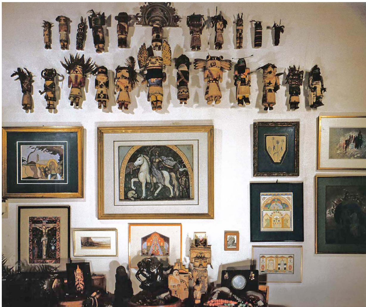
7 Kachinas exposées dans l'Atelier André Breton

« L'absence de ce tableau autour duquel semblait graviter le jour les objets de l'atelier et la nuit les rêves du poète, entraînait obligatoirement la recherche d'un nouvel axe d'aimantation. C'est ainsi que, tournant le dos à la place, au-dessus du lit, précédemment occupée par la célèbre toile de De Chirico, se dressa alors sur la table de travail de l'auteur du Surréalisme et la peinture, une statue de Nouvelle-Irlande dite Uli » 26 .