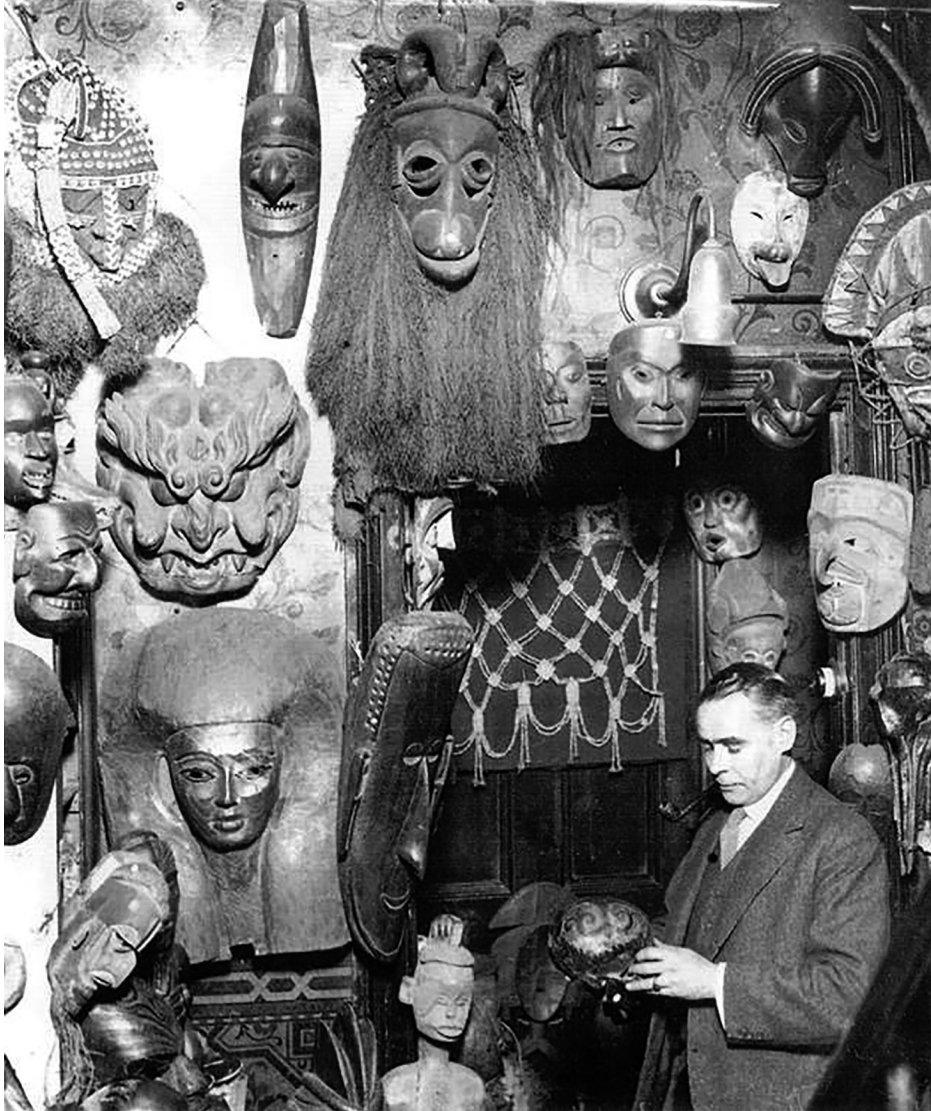
5 Magasin W. O. Oldman vers 1928

Ouest chez ses amis 13 . Il est à noter cependant que s'ils se défont de leurs objets d'Alaska et de la Colombie Britannique, y compris des masques, ils conservent les poupées katsina dont ils possédaient chacun plusieurs exemplaires 14 . Quant à l'acquisition de masques inuit (yup'ik) d'Alaska, elle interviendra à la faveur de