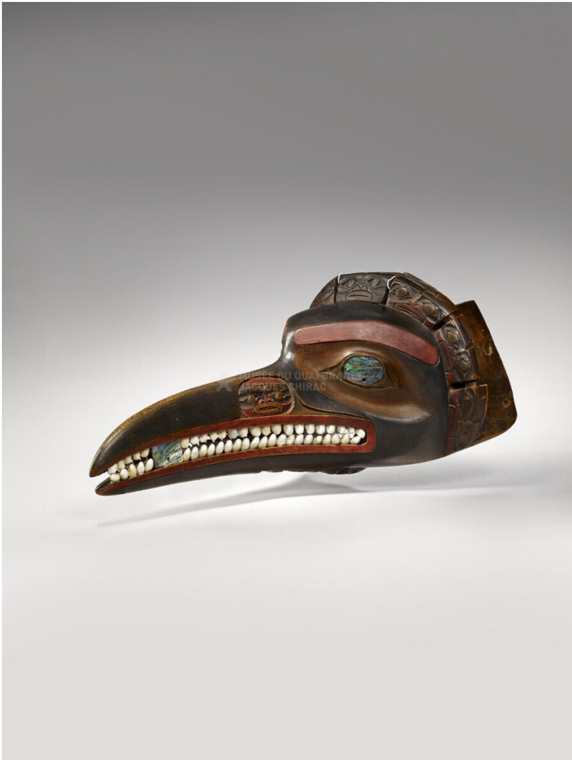
Fig.1. Masque frontal Amérique du Nord (71.1951.35.3)