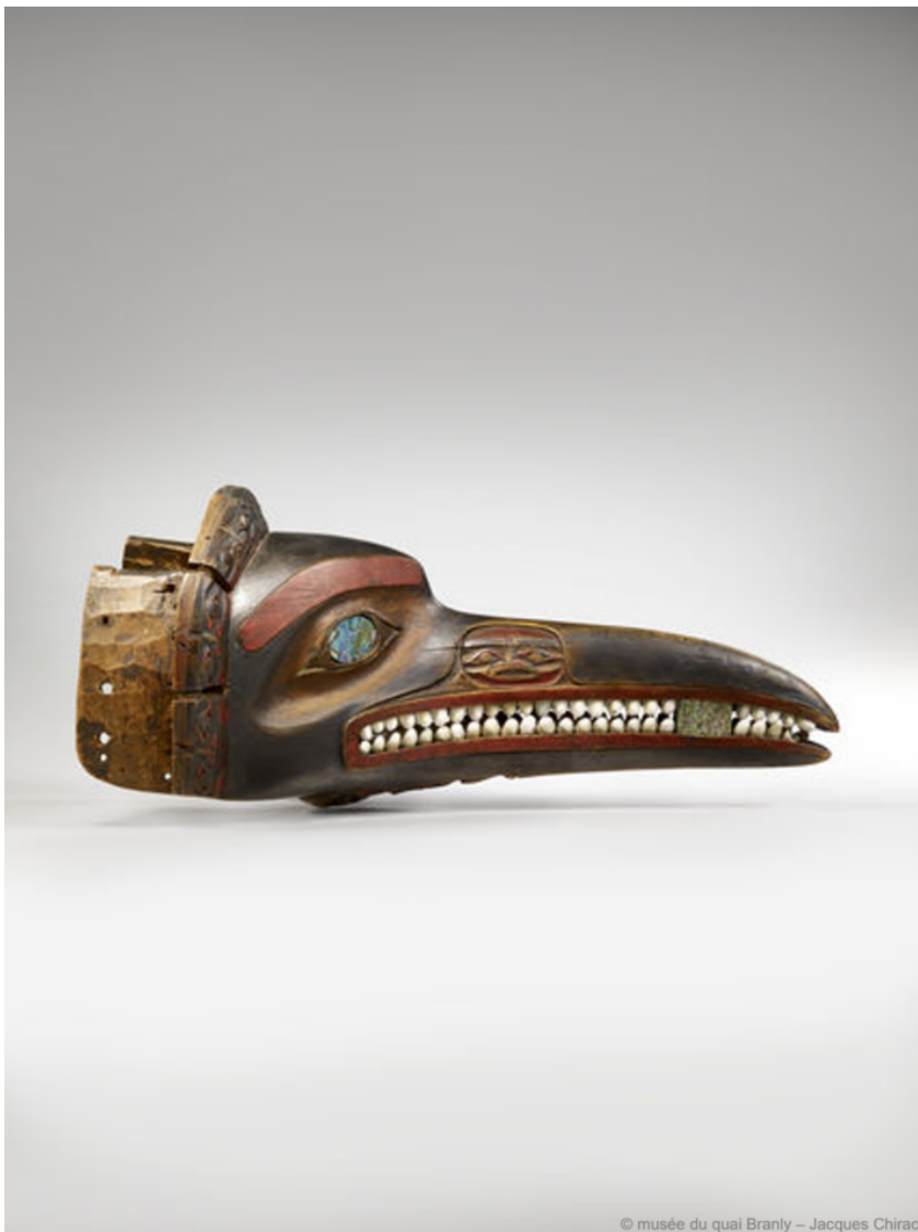
Fig. 4. Masque de l'esprit moustique

Elles étaient organisées par des individus appartenant à une catégorie particulière, des artistes/artisans très qualifiés qui mettaient leur talent à la disposition des chefs pour concevoir des saynètes destinées à capter l'attention du public. Il leur revenait l'énorme responsabilité d'imaginer des dispositifs propres à faire advenir les esprits parmi les humains, de composer des chansons et de sculpter dans le plus grand secret des masques et autres objets liés au naxnox comme les hochets, par exemple.