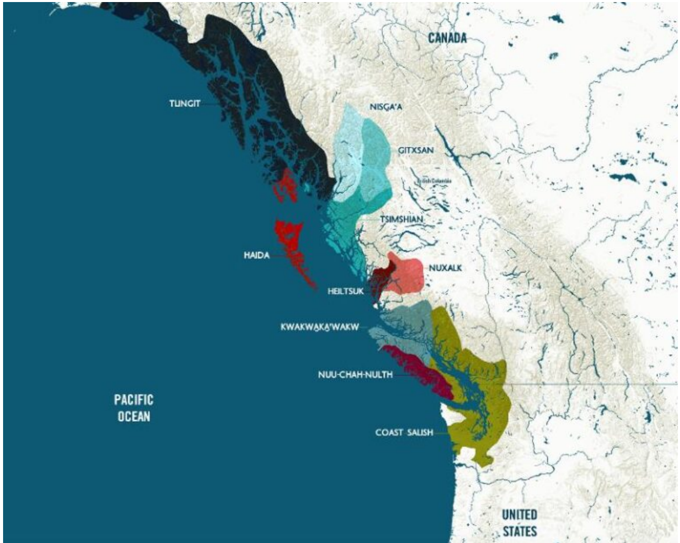
Fig.2. Carte des groupes ethniques de la côte Nord-Ouest

inférieur du fleuve Skeena et une partie de la bande côtière, et les Gitksan, le cours supérieur du Skeena.