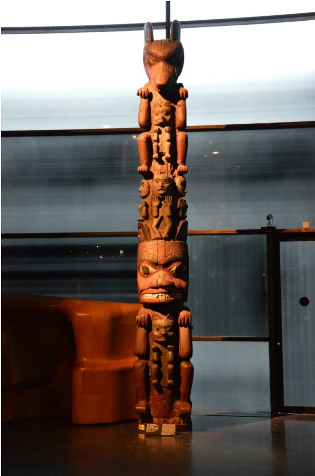
Fig. 5. Mât héraldique du chef Kwarhsu dit mât de l'Ours ou mât Kwarhauh

Le masque de l'esprit-moustique illustre parfaitement le mode de figuration associé à l'ontologie animiste (Descola 2021) où l'image combine les traits physiques de l'entité animale, son intériorité étant révélée par la représentation d'un personnage au large visage et au corps réduit aux bras et aux jambes repliées sous la mandibule inférieure. Selon les conventions de figuration niska'a et tsimshian, les visages humains disposés en couronne autour du masque servent d'indices d'identification ou de manifestation d'un esprit ou d'une forme de vie (McLennan et Duffek 2000 : 118).