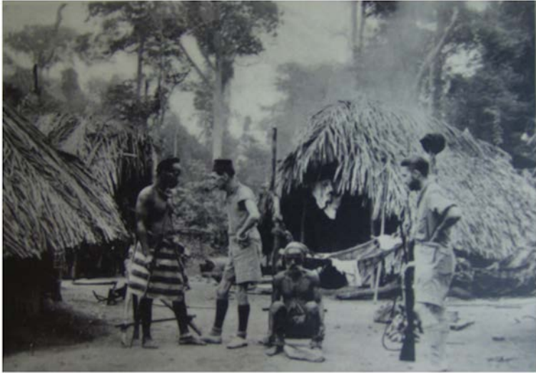
Jacques Soubrier : Savanes et forêts (1936)

Ici, la photographie rejoint l'énoncé du texte qui relate le refus catégorique de ce monsieur âgé de parler avec les intrus. Soubrier met alors en scène – probablement avec un déclencheur automatique – cet échec total de communication, avec ce vieux monsieur qui regarde dans le vide, la position désespérée de Soubrier et la façon dont les deux autres se dévisagent. L'image est gorgée d'artificialité et d'ironie – un chef d'œuvre de représentation d'un échec total de communication qui reflète ou même symbolise sous forme condensée la situation de voyage dans un contexte colonial.