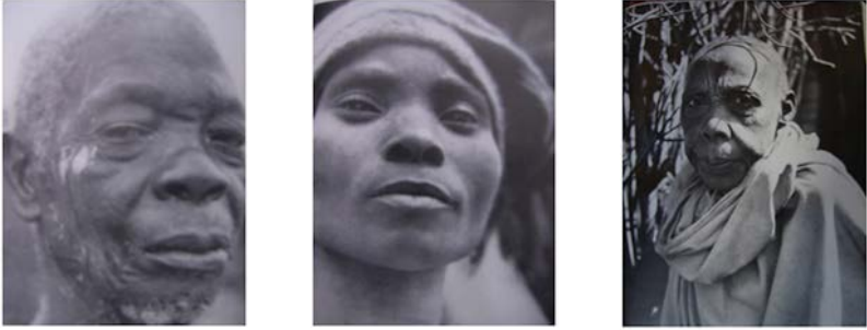
Trois exemples de portraits photographiques publiés dans des récits de voyage : ill. 1 et 2 : Lotte Errell, Kleine Reise zu schwarzen Menschen (1931) ; ill. 3 : Gustav Adolf Gedat, Wunderwege durch ein Wunderland (1938)

Force est de constater qu'il assume une fonction fédératrice en réduisant la distance et en donnant la possibilité au sujet photographié de s'exprimer. Dans le contexte de l'Afrique coloniale, cet aspect nous semble particulièrement important car le but d'un portrait n'est pas la transmission de savoir sur l'Autre. De ce fait, il se distingue nettement de la photographie anthropologique montrant des « types », où le sujet photographié est réduit à un objet d'étude. De même, le portrait évite le voyeurisme et l'écrasement du sujet. Le portrait a donc le potentiel d'aller au-delà de la simple fonction de fournir une documentation, au moment où il ne s'agit pas d'un discours sur l'Autre, mais d'une trace de la tentative du voyageur-photographe pour approcher le plus possible l'individu qui se trouve en face de lui. Ainsi, nous revenons à l'idée de dialogue émotionnel. En tant que témoin de l'acte photographique, c'est-à-dire en tant que miroir de la relation entre photographe et photographié, le portrait contient alors un certain potentiel de dialogue interculturel. Néanmoins, ce dialogue ne peut jamais aboutir, puisque la personne photographiée n'a pas la possibilité de regarder le cliché et ne comprendra donc jamais comment le photographe l'a perçue. Il n'y a pas de possibilité de réplique.