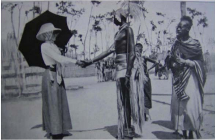
« Le roi Warundi me tend la main », Hélène de France, Duchesse d'Aoste, Voyages en Afrique (1913)

scène soignée qui vise la représentation d'une rencontre entre égaux. Ces deux personnes de rang élevé se serrent la main, en gardant une distance respectueuse et en se regardant dans les yeux. Le fait que tous deux soient de taille élevée semble encore relever leur noblesse. La légende renforce l'approche respectueuse, en insistant sur le fait que c'est le roi Warundi qui tend la main à la visiteuse. De son côté, le roi montre son respect en utilisant le geste européen. Les deux aristocrates choisissent de se mettre en scène ensemble, en tant que représentants de leur rang social qui les unit, comme souverains.