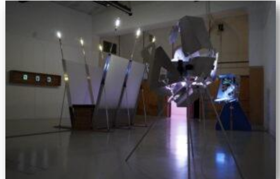
« Veille Infinie », Donatien Aubert