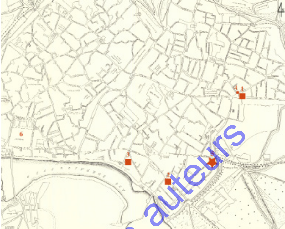
Figure 3. Détail du plan de Cordoue dressé en 1811 par le baron de Karvinski

Localisation des églises de San Lorenzo (1), Santiago (2) et San Nicolás de la Axerquía (3); de l'inscription commémorant des travaux de restauration dans une mosquée (4); de la maison détruite C/ Alfonso XII, 69 d'où provient le chapiteau publié par A. Labarta (5); ainsi que de la grande mosquée de la ville (6). DAO. S. Gilotte.