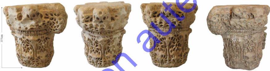
Figure 1. Chapiteau califal composite à deux couronnes d'acanthé daté par son inscription de 347/958-59 (collection privée)

Ce chapiteau de marbre blanc est un composite dit « à bandeau » 2 (fig. 1). Ses proportions montrent qu'il a été sculpté dans un bloc quasi cubique 3 et il existe un fort contraste entre le kalathos cylindrique et le bloc parallélépipédique que forment l'abaque et les volutes massives. Ce sont bien là trois des caractères significatifs des productions omeyyades cordouanes.