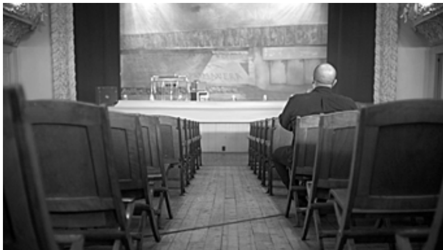
Lawrence Abu Hamdan, still from 45th Parallel , 2022.

del luogo, immergendolo così in una dimensione magica. L'intero racconto pare sprofondare progressivamente in uno spirito fiabesco, enfatizzato dalla tipologia dello spazio scelto per questa narrazione. Fleifel, infatti, parla all'interno della sezione di narrativa per bambini sedendo su uno sgabellino e adottando un tono di voce pacato, delicato e ben scandito; in sostanza, lo stesso solitamente adottato per raccontare le favole ai bambini. L'assenza di quest'ultimi ricorda, tuttavia, che l'unico pubblico a cui la storia è somministrata è composto da chi osserva il film, che viene, dunque, qui introdotto alla sfumatura più semplicistica del border : la linea tra due paesi, che, peraltro, si manifesta in ripetuti shot dell'adesivo nero che corre, rimarcandola, lungo il pavimento della biblioteca.