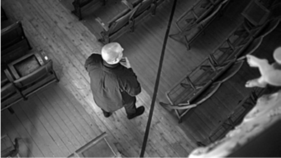
Lawrence Abu Hamdan, still from 45th Parallel , 2022.