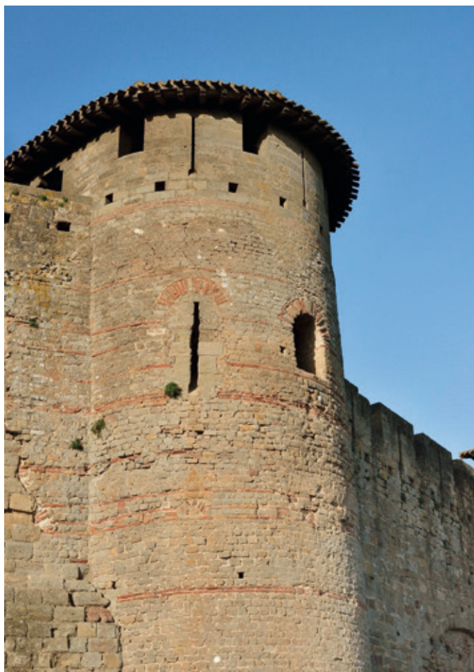
Fig. 4 Tour dite de la Marquière, l'une des mieux conservées de l'enceinte antique tardive de Carcassonne. Carcassonne est l'une des rares cités de Septimanie à avoir conservé une partie de son rempart « tardo-romain ».

d'incertitudes mais toutefois d'un réel ancrage, sous la férule d'un dernier roi, Achila II dont l'existence est avérée par des découvertes archéologiques (monétaires), puis peut-être encore d'un certain Ardo. Elles doivent maintenant s'accommoder de la domination des Omeyyades !