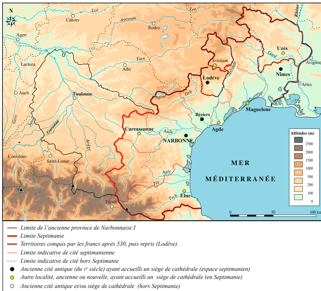
Fig.2 La Septimanie des VI e -VII e siècles, stabilisation d'un territoire « gothique » dans les Gaules.

réminiscences historiques ou littéraires, remploie l'hapax de Sidoine Apollinaire, reformule une ancienne nomenclature ou invente ! Mais il donne une invraisemblable postérité au terme.