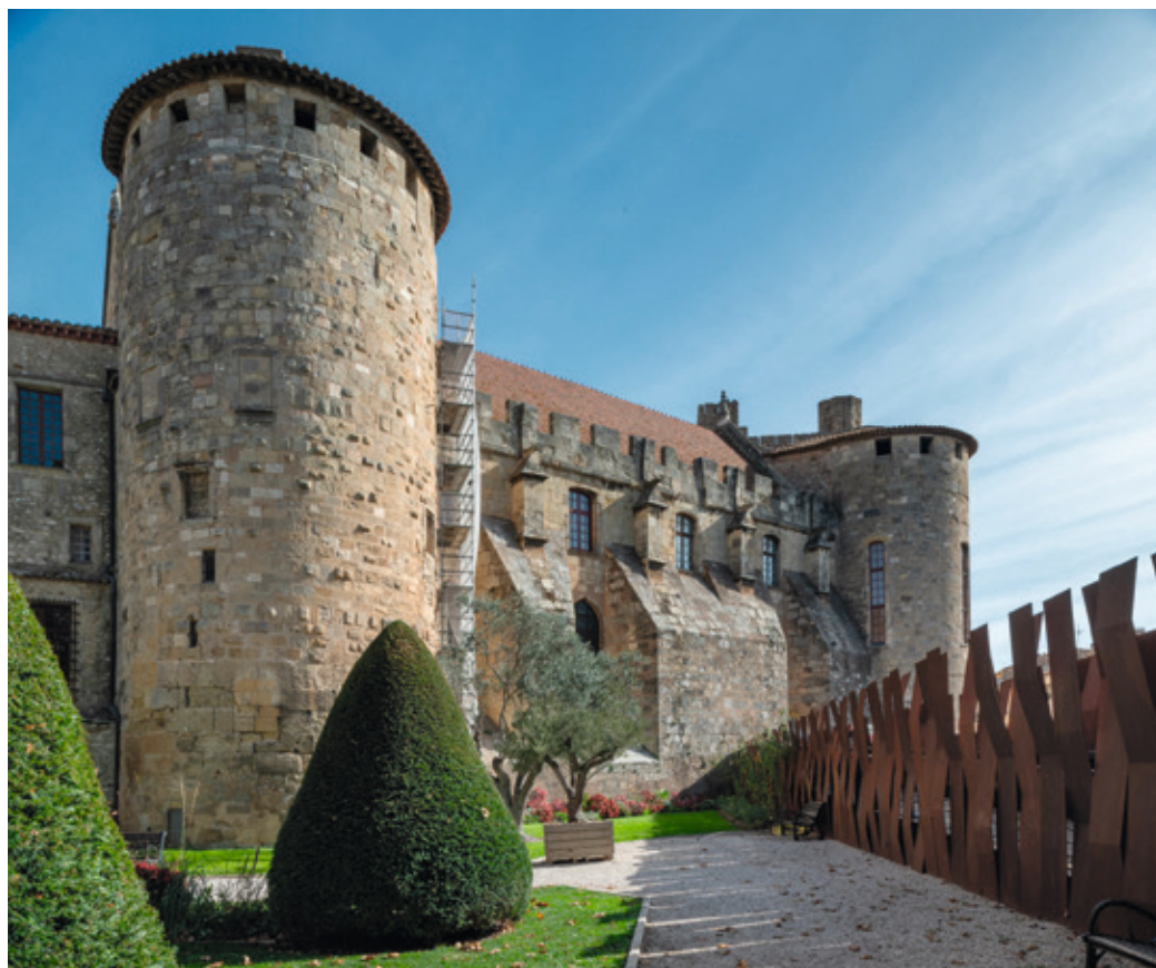
Fig.3 Courtine et tours attribuées à l'enceinte de l'Antiquité tardive dans les murs du palais neuf de l'archevêché de Narbonne.

Depuis 507 et la bataille de Vouillé, les Francs ont contraint les Wisigoths à se replier vers la Méditerranée, à Narbonne où s'installe la cour royale, puis progressivement, car il s'agit d'un processus, dans les Espagnes, à Barcelone en Tarraconaise, et enfin à Tolède en Carthaginoise. Stratégiquement, les Francs ont pris Toulouse et amputé la vieille province de Narbonne de l'une de ses plus grandes cités et surtout de son axe vers l'Atlantique et une partie des Pyrénées.