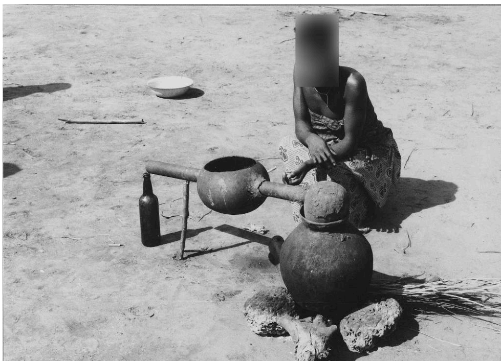
Figure 3 : Distillatrice et son matériel de distillation, Zaïre, 1971 127