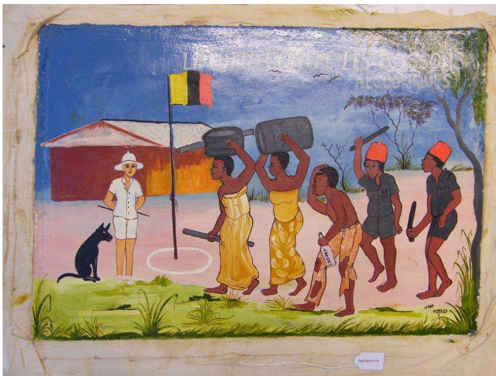
Figure 1 : Ona Ndaji, La lutte contre les boissons alcooliques , s. d.