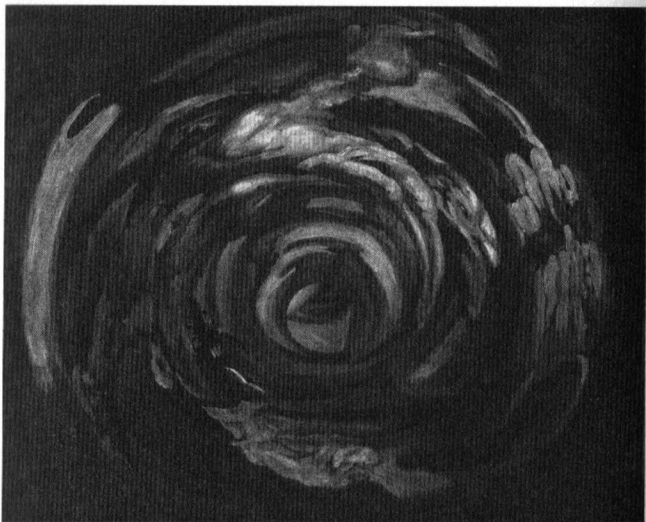
Illustration : Domenico Piola, Anamorphose d'après L'Érection de la Croix de Rubens , Musée des Beaux-Arts de Rouen.

Locke analyse l'effet de cette peinture dans une argumentation complexe, qui vise à la distinguer d'un simple désordre formel, produit par un mélange de couleurs et de formes sur la surface de l'image. Le tableau d'un ciel de nuages, remarque le philosophe, serait en réalité porteur d'un plus grand mélange et brouillage, de taches bleues, blanches ou sombres, et ne serait pas pour autant dit confus. Ce n'est donc pas le mélange formel à la surface de la peinture qui produit la confusion. La même raison vaut pour « un tableau fait à l'imitation de » cette étrange peinture confuse de César. Imitation, ici, est à prendre au sens de l'esthétique classique, celui de la mimésis picturale. Locke n'évoque pas une simple copie de la peinture, mais une représentation de cette dernière, un tableau du tableau. Quand le tableau d'origine est confus, un tableau qui en ferait son objet, et se le donnerait comme le contenu de sa représentation, ne le serait plus. Ainsi, le tableau de Domenico Piola ci-dessus est confus, mais la photographie qui nous le représente est distincte en tant que représentation d'un tableau, alors qu'elle est formellement, en sa surface même, faite des mêmes compositions de couleurs dans le même ordre et le même assemblage. La confusion dans l'image n'est