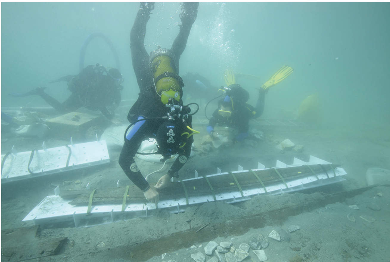
Démontage de l'épave de Zambratija, juillet 2023