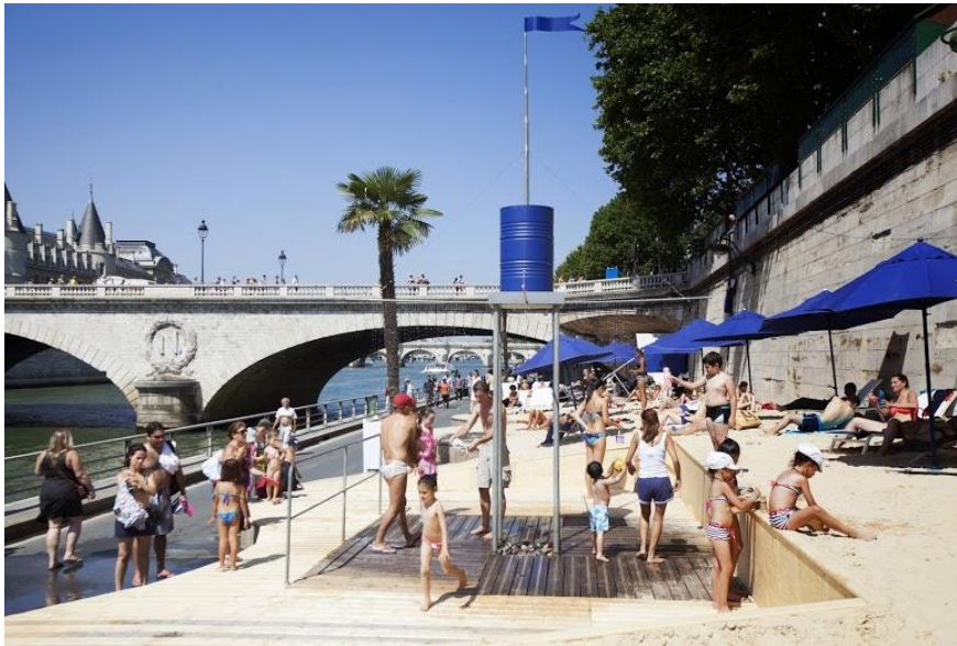
Figure 4 : L'opération Paris-Plage en 2013

particulières. Elle a rendu la ville détestable et les efforts sont portés aujourd'hui sur la réduction de son emprise.