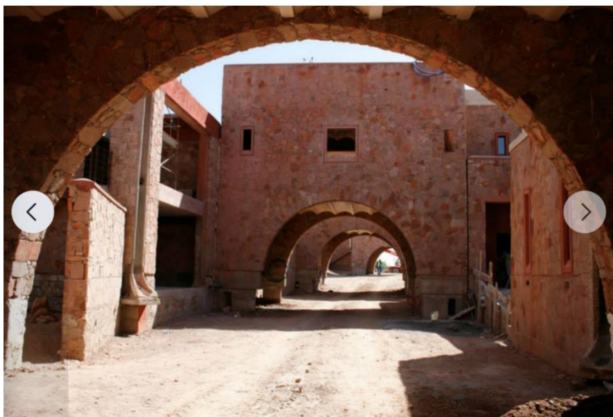
Figure 8 : Résidences en construction pour les chercheurs de l'Université Mohammed VI (Elie Mouyal, architecte)

Comme beaucoup d'autres productions, celle des maisons doit revenir à l'utilisation des ressources locales. Lorsque nous disons maison, terme qui trouve une traduction dans toutes les langues, nous pensons collectif et individuel, car le mot logement est une catégorie qui relève de la statistique et du décompte de sa pénurie qui est criante, y compris dans les pays développés. En termes de construction, les bâtiments vernaculaires présentent des qualités qu'il est nécessaire de réactualiser, tant au plan des matériaux employés que des techniques d'édification et des dispositions de l'espace dans son environnement (Rapoport, 2003). La pierre, la brique et le bois doivent concourir plus largement à la construction en remplacement du béton, grand gaspilleur d'énergie (Fig. 8).