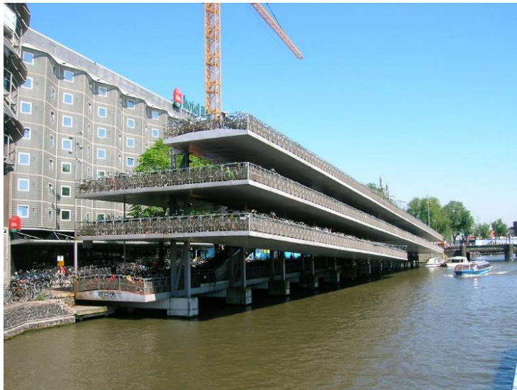
Figure 7 : Le silo à vélos de la Gare d'Amsterdam Des maisons habitables et maîtrisables

Comme beaucoup d'autres productions, celle des maisons doit revenir à l'utilisation des ressources locales. Lorsque nous disons maison, terme qui trouve une traduction dans toutes les langues, nous pensons collectif et individuel, car le mot logement est une catégorie qui relève de la statistique et du décompte de sa pénurie qui est criante, y compris dans les pays développés. En termes de construction, les bâtiments vernaculaires présentent des qualités qu'il est nécessaire de réactualiser, tant au plan des matériaux employés que des techniques d'édification et des dispositions de l'espace dans son environnement (Rapoport, 2003). La pierre, la brique et le bois doivent concourir plus largement à la construction en remplacement du béton, grand gaspilleur d'énergie (Fig. 8).