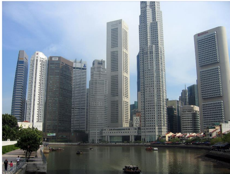
Figure 3 : Le CBD (Central Business District) de Singapour

lot de ces péri-urbains et la pollution de ces millions de moteurs celui de tous les habitants des métropoles car un tel étalement rend l'alternative des transports en commun quasi impossible.