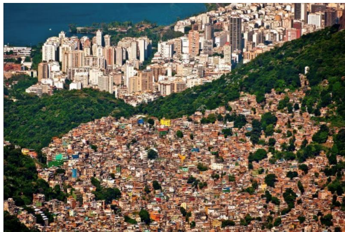
Figure 2 : Rio de Janeiro ( https://www.civitatis.com/fr/rio-de-janeiro/visite-favela/ )

Ces deux versants de l'économie, celle qui innove et celle qui spéculé, construisent un monde où le meilleur côtoie le pire : la production des inventions technologiques les plus sophistiquées est engendrée par l'attente d'une vie meilleure et plus belle et les sociétés demandent à ce que leur création profite au maximum de personnes ; mais les flux financiers que nécessitent leur production et la commercialisation de ces innovations sont dominés par un appât du gain qui, ne pouvant conduire à une répartition équitable de la richesse créée, donne naissance à des inégalités criantes. Dans les villes, un habitat misérable (Davis, 2006) coexiste avec des quartiers d'un luxe insolent (Fig. 2).