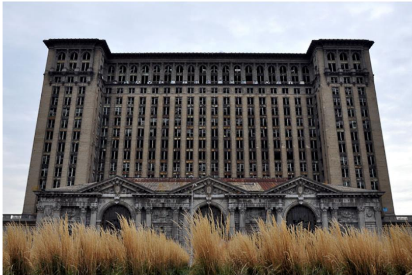
Figure 1 : Siège d'usine désaffectée à Detroit ( https://www.lepoint.fr/automobile/detroit-se-declare-en-faillite-18-07-2013-1706281_646.php#11 )

celui d'un Européen et le Chinois ne vit-t-il pas les progrès de son pays - qui abrite le cinquième de la population du monde - d'une façon aussi pessimiste...