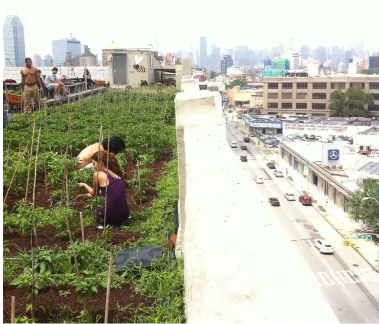
Figure 6 : Brooklyn Grange , jardin sur le toit d'un immeuble à New York :

https://www.facebook.com/BrooklynGrange/photos_stream