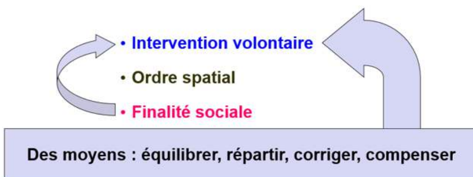
Illustration 2 : Qu'est-ce que l'aménagement du territoire ?