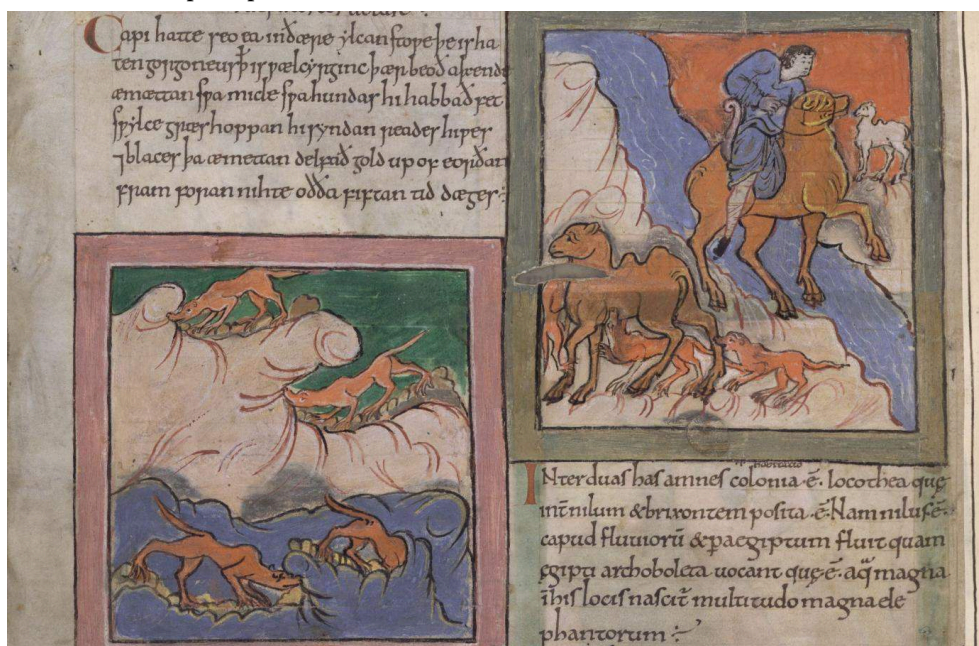
Illustration 1 : Fourmis chercheuses d'or dans la traduction en moyen anglais du De rebus in oriente mirabilibus . Ms. London BL Cotton Tiberius B V 1, XI e s., f. 80v, visible sur cette page : https://blogs.bl.uk/digitisedmanuscripts/2013/04/how-the-camel-got-the-hump.html