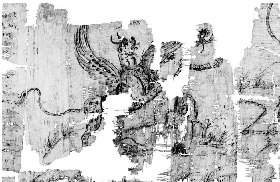
Illustration 2 : Le myrmex du papyrus d'Artémidore (figure V22). Reproduction visible sur la page : https://likeavirgil.tumblr.com/post/70358578945/sketches-of-real-and-mythical-animals-from-the