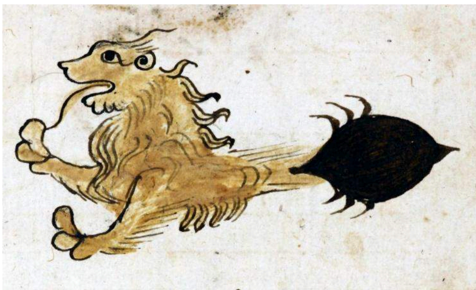
Illustration 4 : Le myrmicoleon dans le Physiologos grec. Leipzig, Universitätsbibliothek, cod. gr. 35, XIV e s., f. 34.