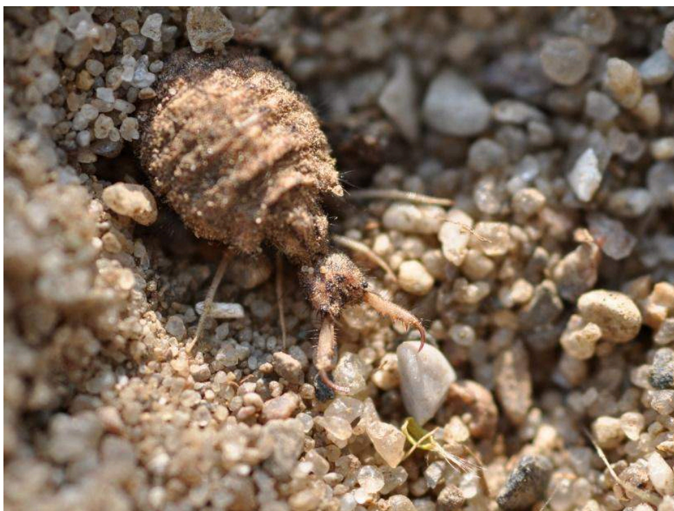
Illustration 5 : Fourmilion sous forme larvaire.