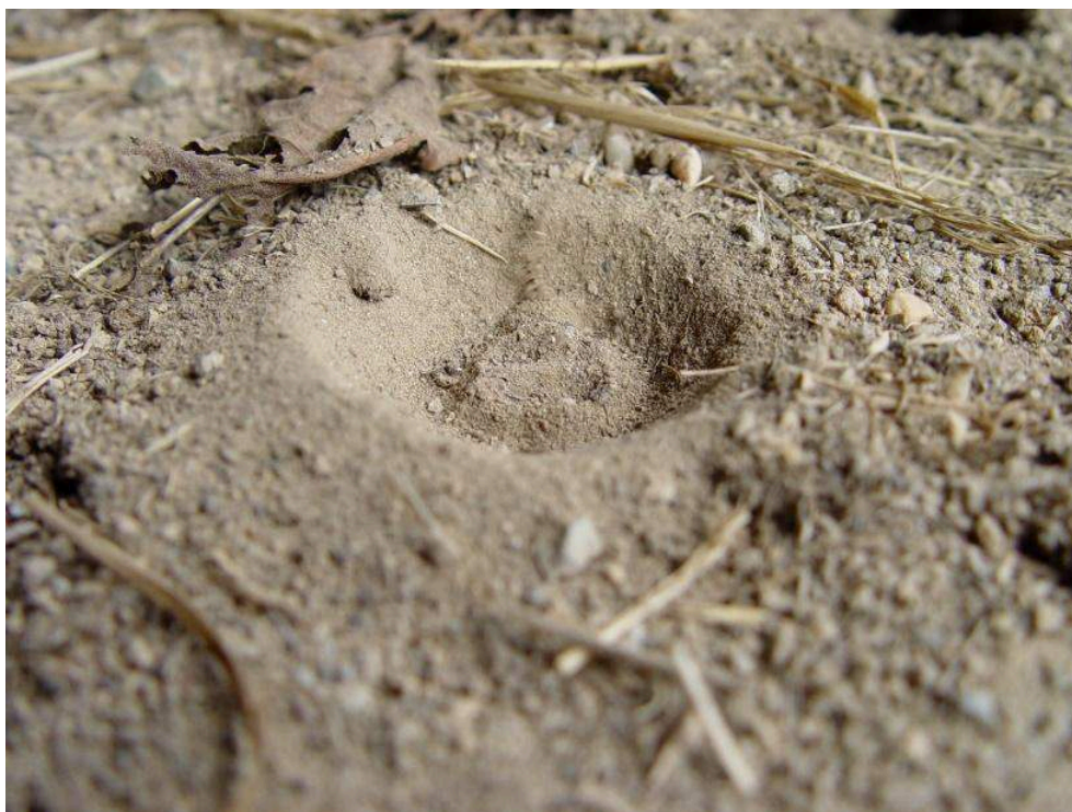
Illustration 6 : Piège du fourmilion, en forme d'entonnoir.