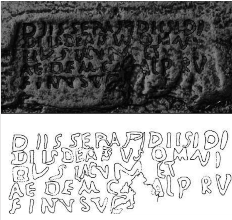
Fig. 4. CIL, II, 2395a dans Pires et al. 2014.