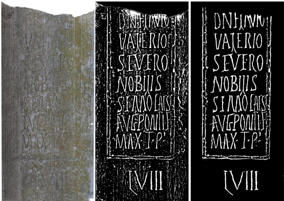
Fig. 8. Analyses morphologiques des d tails de la borne milliaire de Flavius Valerius Severus.