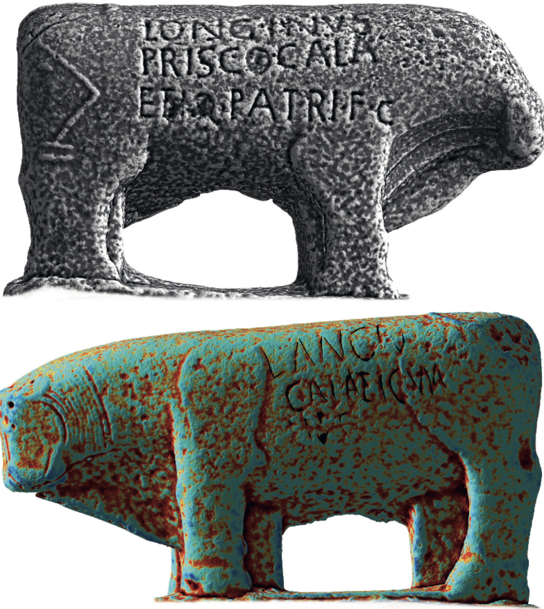
Fig. 5. Taureau 1 avec inscription CIL, II, 3052, dans Fabián et al. 2021.

Un autre exemple concerne les sculptures tauriformes connues comme les Taureaux de Guisando (un site archéologique près d'Avila en Castille centrale). Il s'agit de quatre taureaux faisant partie d'une tradition de sculpture pré-romaine de la tribu des Vettones dans la partie centre-ouest de la péninsule Ibérique. Pour autant, ces monuments précis datent de l'époque romaine et ont servi de support à des inscriptions latines. Depuis la fin du Moyen Âge, différentes lectures de leurs textes ont ainsi été proposées. Étant donné la difficulté de l'exercice, une équipe hispano-portugaise a décidé, il y a quelques années, d'appliquer un procédé similaire à celui du sanctuaire de Panóias sur ces sculptures ( fig. 5 ). Les résultats ont bouleversé la compréhension de ces textes, bien plus complète qu'auparavant. Il s'agit ainsi d'un groupe particulier d'inscriptions funéraires, dont les dédicacées, des familles des Lancii et des Longinii , faisaient partie de la même cognatio ou clan, les Calaetici .