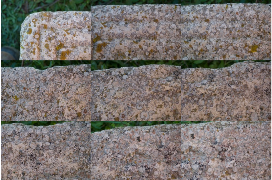
Fig. 1. Acquisition photogrammétrique : échantillon d'images séquencées de la partie supérieure d'un support épigraphique.

Enfin, si la pratique actuelle semble être devenue triviale sur certains logiciels, il ne faut pas oublier que la valeur de la modélisation est proportionnelle à la rigueur des photographies acquises ; ce problème exclut, de fait, certains types d'acquisitions dont on ne peut ni connaître le paramétrage, ni enregistrer les limites, éléments obligatoires à toute expérience scientifique.