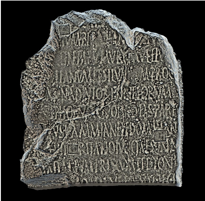
Fig. 6. AE, 2001, 2083 (face 1). Analyse sur le sujet réel : rendu "Radiance Scaling" (Meshlab).