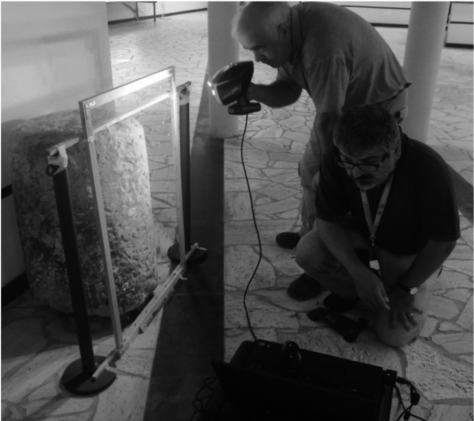
Fig. 2. Numérisation d'une inscription avec un scanner laser à triangulation optique dans Ganga et al. 2015, 1578.

On comprendra alors comment, sur ce cliché ( fig. 2 ), S. Ganga, collaborateur dans le présent volume, avec les professeurs A. Gavini et M. Sechi, sont parvenus à déchiffrer certaines lettres peu visibles à l'œil nu sur une colonne votive, à l'aide d'un scanner laser à triangulation optique projetant une croix laser à la surface à numériser.