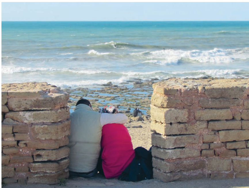
Photographie 1 – La spatialisation de la séduction et du flirt sur le littoral de Rabat (Cliché : Christophe Guibert, avril 2016)

créneaux de la vieille muraille face à la mer, qui sont ici utilisés pour s'asseoir et s'enlacer, à l'abri des regards.