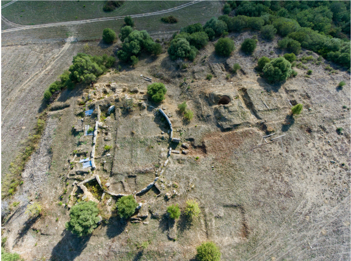
Fig. 2. Vue depuis le nord sur l'amphithéâtre (à g.) et la tranchée ouverte sur l' agger (à d.)