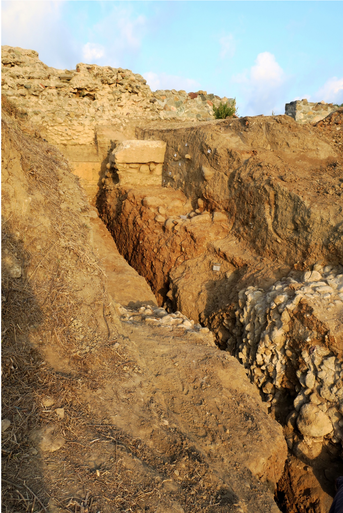
Fig. 4. Tranchée ouverte en 2021 devant les murs hellénistiques. Au premier plan à dr., l'enceinte romaine effondrée; en haut à g., l'enclos de l'amphithéâtre édifié sur la courtine hellénistique