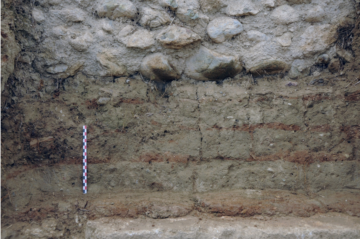
Fig. 6. Détail voisin de la vue précédente : les assises en brique crue de la courtine hellénistique