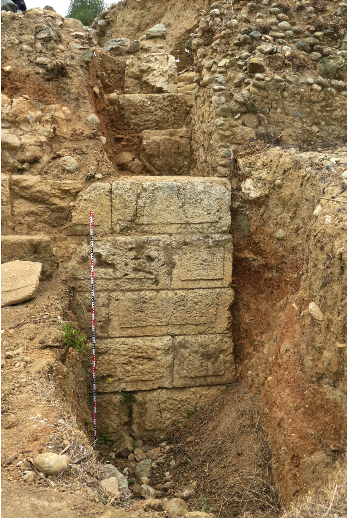
Fig. 3. Angle nord-est de la tour hellénistique. En haut à dr., l'enceinte romaine en opus caementium butant contre la partie épierrée du flanc nord de la tour