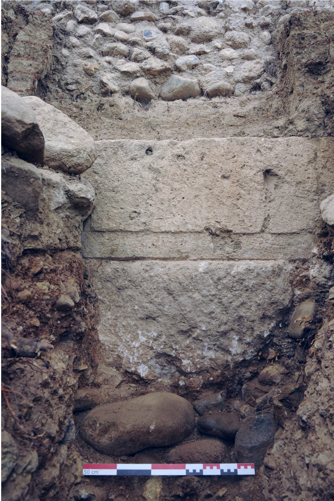
Fig. 5. La courtine hellénistique sous-jacente à la maçonnerie de galets noyés dans le mortier délimitant l'amphithéâtre