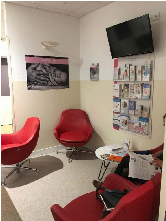
Photo 2 : Espace d'attente à l'intérieur de la maternité par laquelle on entre après avoir appelé l'accueil par interphone