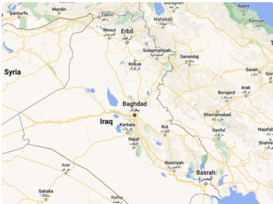
Fig 1. Carte de l'Irak avec la position d'Erbil (Google Map)