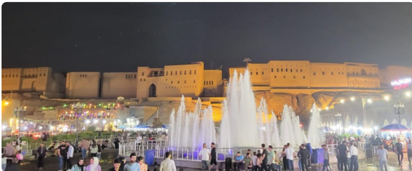
Fig. 2 : La forteresse (et la porte sud) d'Erbil, le soir

Les fouilles archéologiques dirigées par Georges se trouvent, l'une, dans la citadelle d'Erbil même, où il s'agit de suivre la succession des occupations humaines sur le tell et retrouver des niveaux d'occupation de l'âge du Bronze ; l'autre, dans la ville basse à la recherche du second mur d'enceinte néo-assyrien et pour caractériser l'occupation de cette zone. L'enjeu de ces fouilles est d'importance, aucune fouille suivie n'avait été faite à Erbil auparavant et ces emplacements sont très prometteurs.