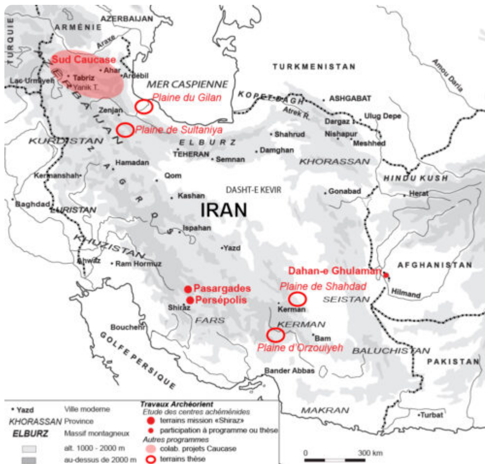
Fig. 2 : Carte de localisation des terrains étudiés par des membres d'Archéorient depuis vingt ans en Iran