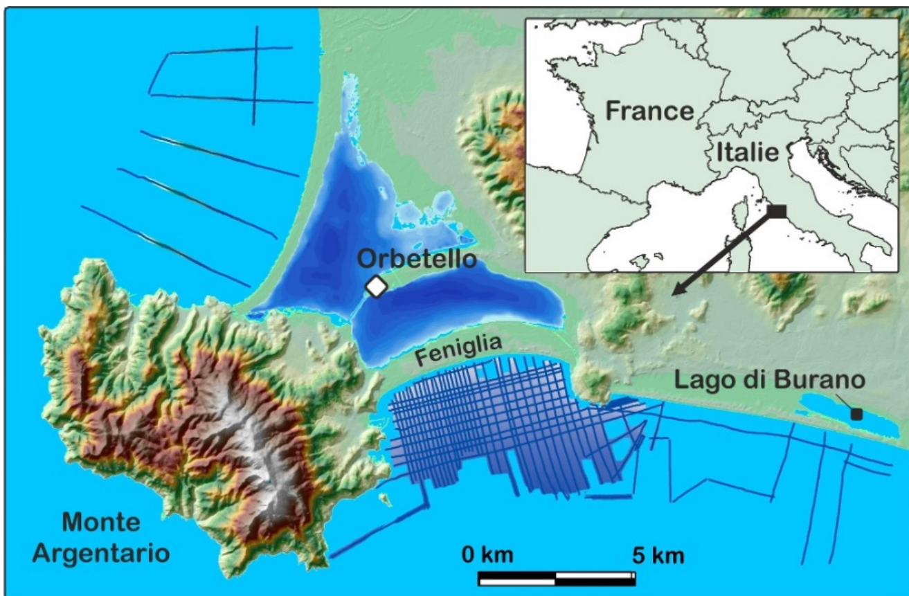
Fig. 3 : La lagune d'Orbetello (Toscane, Italie) encadrée par ses deux tombolos reliant le Monte Argentario. La ville d'Orbetello sur le 3 e tombolo central, plus ancien. La lagune de Burano séparée de la mer par un lido sableux. Les tracés, de couleur bleue, représentent les profils sismiques en mer.

Sur le littoral de Toscane, sur le pourtour du Monte Argentario, des grottes immergées et émergées ont, elles aussi, permis de mieux comprendre l'évolution des paysages côtiers. L'analyse des spéléothèmes (stalagmites et stalactites) de calcite a permis de reconstituer à la fois l'environnement de l'époque, le contexte paléogéographique, mais aussi les variations relatives du niveau marin.