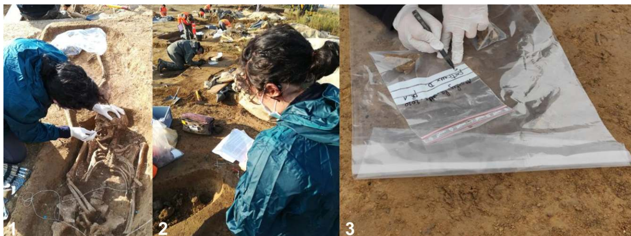
Figure 3. Exemples de prélèvements d'échantillons réalisés sur le terrain, fiche d'enregistrement et conditionnement (Crédits photos 1 et 2 – Sophie Lafosse. Photographies prises avec l'autorisation de la responsable d'opération Aurélie Mayer ; Crédits photo 3 - Jean-Gabriel Pariat. Photographies diffusées avec l'autorisation de la responsable d'opération Aurélie Alligri) / Examples of archaeological sampling in the field, sampling sheet and packaging (Photo credits 1 and 2 - Sophie Lafosse. Photographs taken with the authorization of the operation manager Aurélie Mayer; Photo credits 3 - Jean-Gabriel Pariat. Photographs released with the permission of the operation manager Aurélie Alligri)

extraction ADN, exploitation de l'ADN et des résultats) du projet (figure 1) 3 . Si un projet d'analyse souhaite inclure des échantillons de beDNA alors que l'opération dont ils sont issus est toujours en cours, l'accord du responsable d'opération est un préalable à tout examen par les services de l'État.