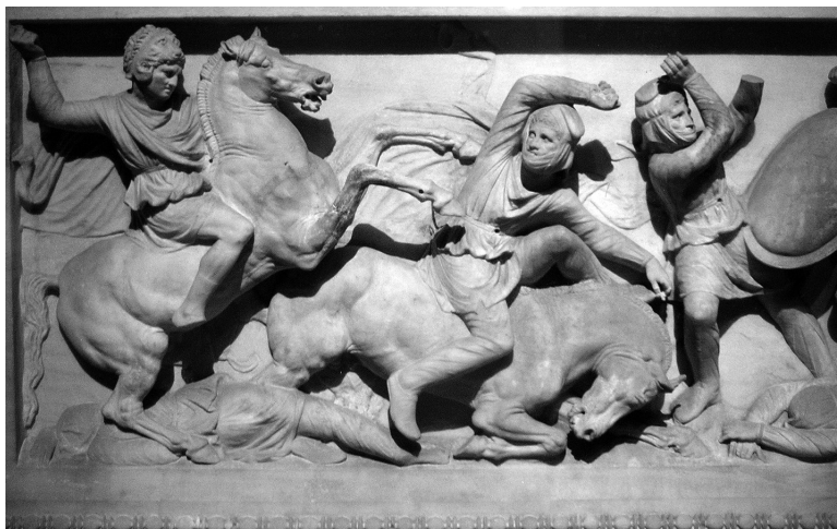
Figure 1 : Détail du sarcophage d'Alexandre, Musée d'archéologie d'Istanbul.

durant laquelle ses armées affrontent celles de Darius III 19 . Sur l'un des grands côtés, Alexandre, coiffé d'une peau de lion, s'apprête à abattre son cheval cabré sur un Perse à demi retourné vers lui, peut-être déjà transpercé par la lance qu'Alexandre devait originellement tenir. Le Perse est représenté en train de sauter ou de tomber de son cheval qui lui-même s'effondre, un genou à terre et l'antérieur gauche tendu, dans une dernière révérence macabre.