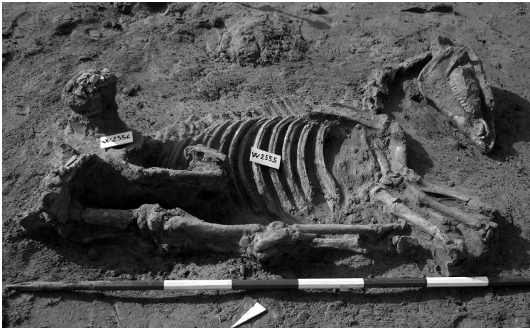
Figure 4 : Inhumation d'un cheval mort durant la bataille de 480 dans la nécropole occidentale d'Himère (© Soprintendenza BB.CC.AA di Palermo).

Le second cas d'inhumation de chevaux sans aucun doute de guerre dans le monde grec antique provient également d'une colonie occidentale, celle d'Himère, fondée vers 648 avant J.-C. sur la côte nord de la Sicile. La cité est célèbre pour les deux attaques qu'elle subit en 480, puis 409 avant J.-C. de la part des armées carthagoises, la première s'achevant par une rapide victoire des Grecs, la seconde se soldant par une terrible défaite. Des fouilles conduites entre 2008 et 2018 dans la nécropole Ouest, sous la direction de Stefano Vassallo, ont mis au jour plus de 15 000 tombes, dont plusieurs fosses communes de soldats relatives aux deux batailles d'Himère 48 . Or, outre ces fosses exceptionnelles, le site est aussi remarquable en raison de la découverte de 27 inhumations de chevaux ( fig. 4 ), dont deux portaient encore leur mors de bronze, ainsi que de nombreux ossements de chevaux sporadiques répartis sur l'ensemble de la nécropole. Bien qu'aucune de ces inhumations n'ait contenu de mobilier, elles ont pu être datées par la stratigraphie du début du V e siècle avant J.-C. Or les nombreux traumatismes d'ores et déjà visibles sur les ossements 49 – bien que l'étude archéozoologique ne soit pas encore achevée – permettent de faire l'hypothèse qu'il s'agit de chevaux morts dans la bataille de 480.