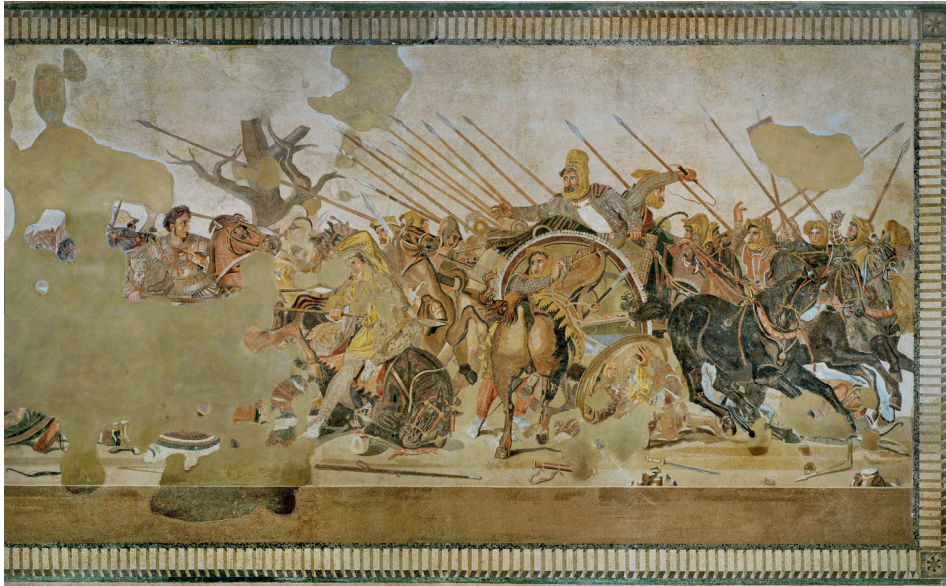
Figure 2 : Mosaique d'Alexandre, Musée archéologique national de Naples.

Un cheval « couché en vache » figure aussi sur une stèle funéraire de Bithynie du III e siècle avant J.-C. 21 , entre deux chevaux affrontés. Bien que le contexte suggère qu'il est probablement tombé au combat, l'absence de cavalier visible et son positionnement au centre de l'image lui donnent un air paisible, presque endormi plus que mourant – l'enjeu ici étant probablement la symétrie de l'image plutôt que le réalisme. Les représentations de chevaux mourants demeurent ainsi rares dans l'iconographie grecque antique 22 et ne permettent guère d'appréhender de manière détaillée les causes et les conditions de leur mort au combat.