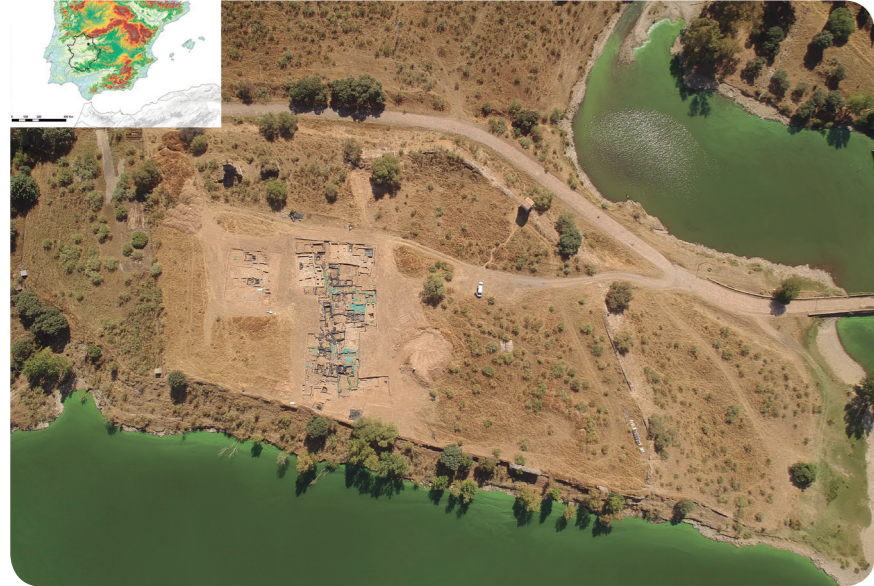
Vista aérea del yacimiento de Albalat

( Majâdat al-Balât o el vado de la vía), facilitaría el empleo de este tipo de artes de pesca.