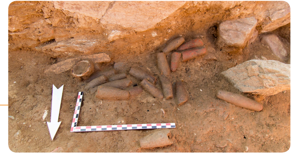
Conjunto de 19 pesas hallado en una estancia del sector norte excavado intramuros.

25 artefactos de barro cocido Peso: entre 22 y 77 g Longitud: entre 4 y 10 cm Pastas: férricas, densas, sin tratamiento de superficie