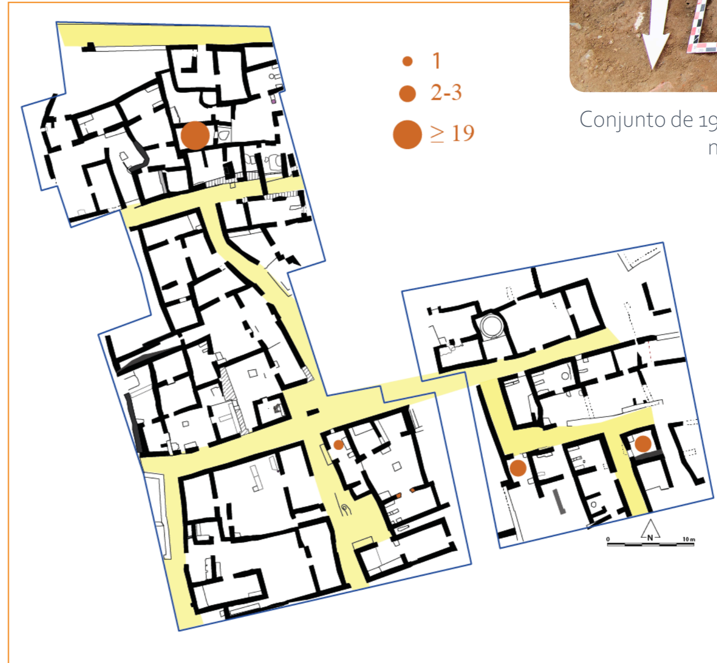
Distribución espacial de las pesas de red de cerámica en la zona intramuros.