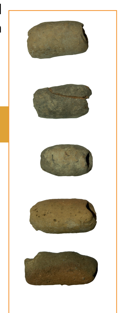
1 & 2: Dibujos y fotos del conjunto de pesas de red (Dib: Y.C.G./DAO: C.V.); 3 & 4: Dibujos y fotos de otros lastres de barro cocido (Dib/DAO: S.G.).