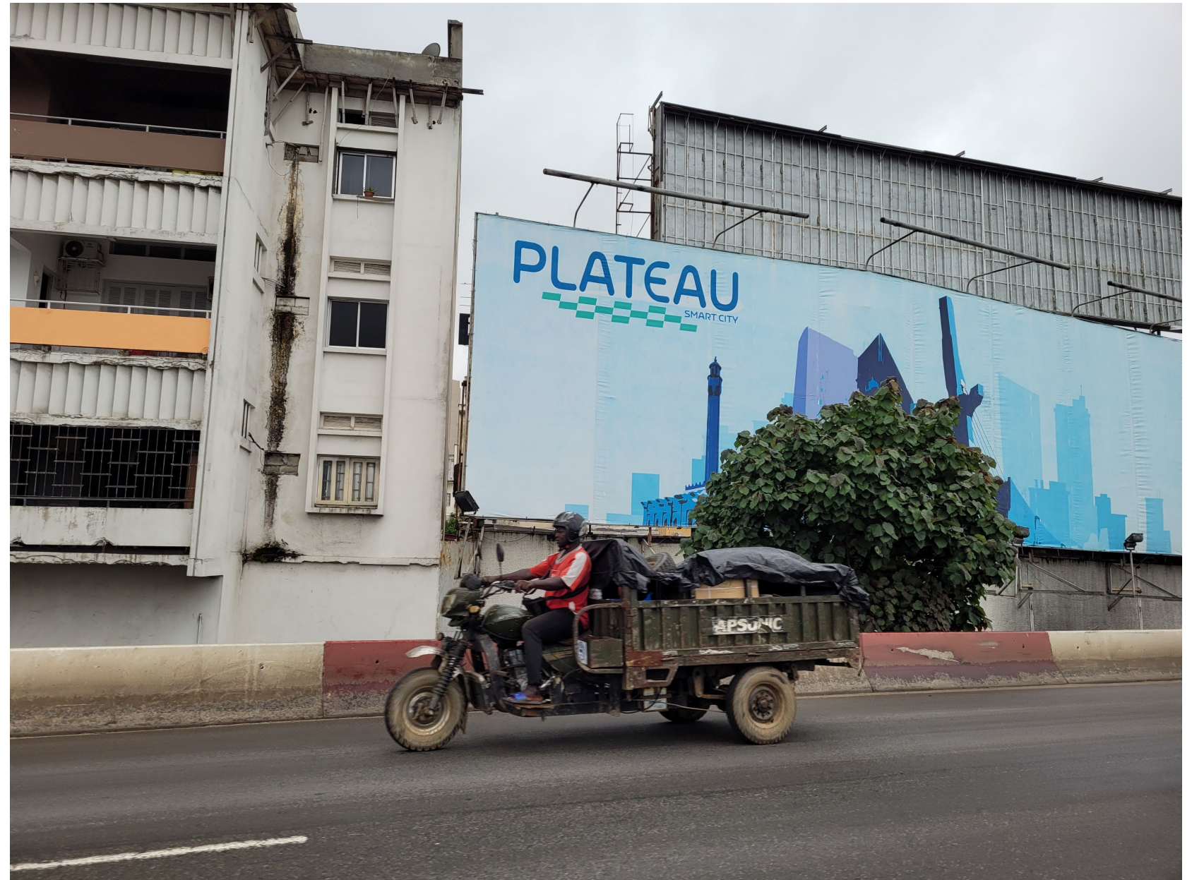
Abidjan, crédit : G. Lesteven, 2021