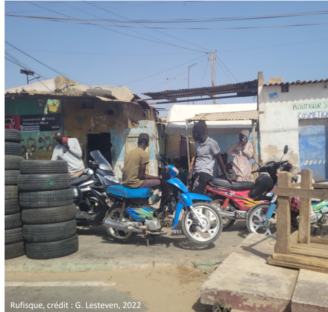
Rufisque, crédit : G. Lesteven, 2022