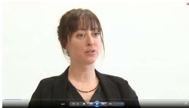
Figure 1 – Plan rapproché.

La zone de révélation arrive soit à la seconde 13 dans la vidéo avec révélation précoce soit à la seconde 51 dans la vidéo avec révélation tardive. L'enchaînement des séquences est décrit dans la figure 4.