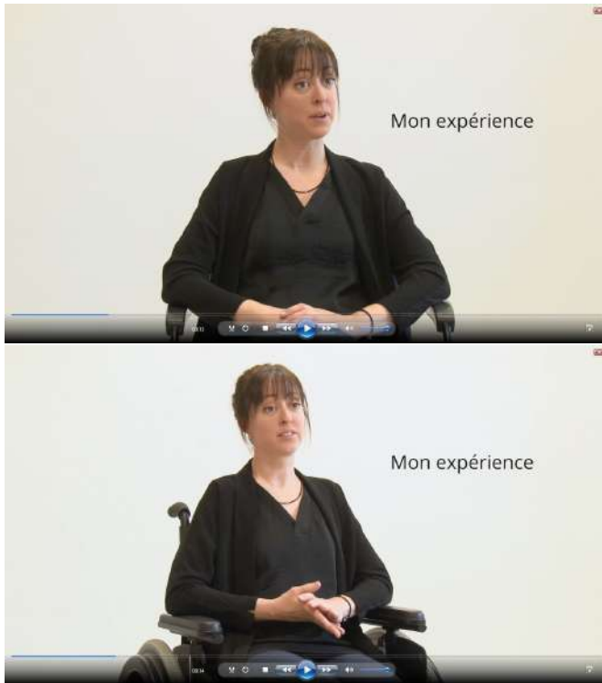
Figure 2 – Plan large.

Notes : Images extraites du CV Vidéo. L'image supérieure ne révèle pas de handicap. L'image inférieure révèle la présence du fauteuil roulant.