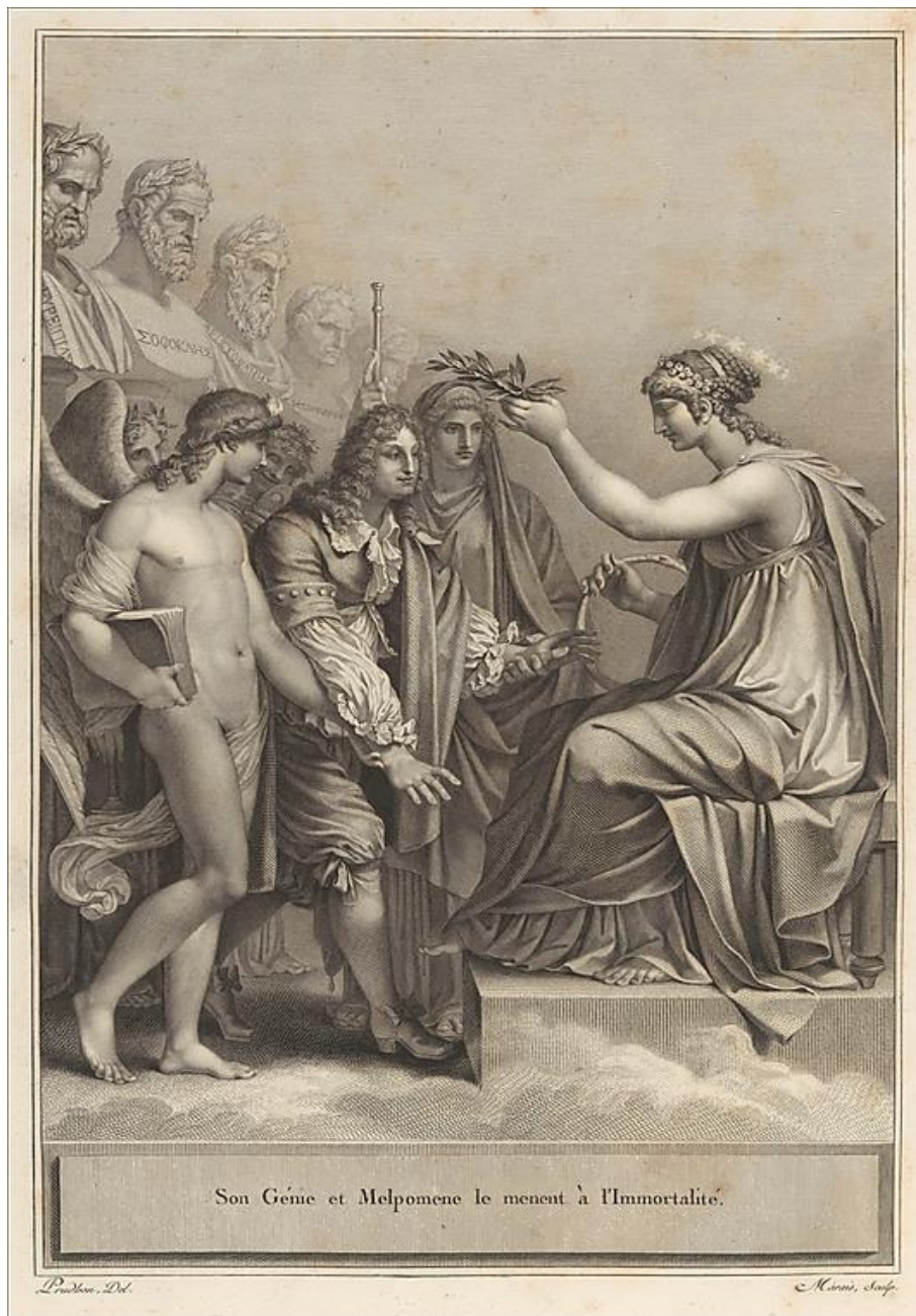
III. 1. Pierre-Paul Prudhon, « Son Génie et Melpomène le mènent à l'Immortalité. », Œuvres de Jean Racine. Tome premier , Paris, de l'Imprimerie de Pierre Didot l'aîné, au Palais National des Sciences et des Arts, An IX [1801], Frontispice.

L'importance capitale de l'iconographie dans la valorisation commerciale de l'ouvrage est confirmée quelques années plus tard, lorsque Firmin Didot, non seulement fondateur de caractères mais collectionneur avisé et bibliophile, se résout à disperser son exceptionnelle bibliothèque pour amortir des « investissements considérables et peu rentables 24 . »