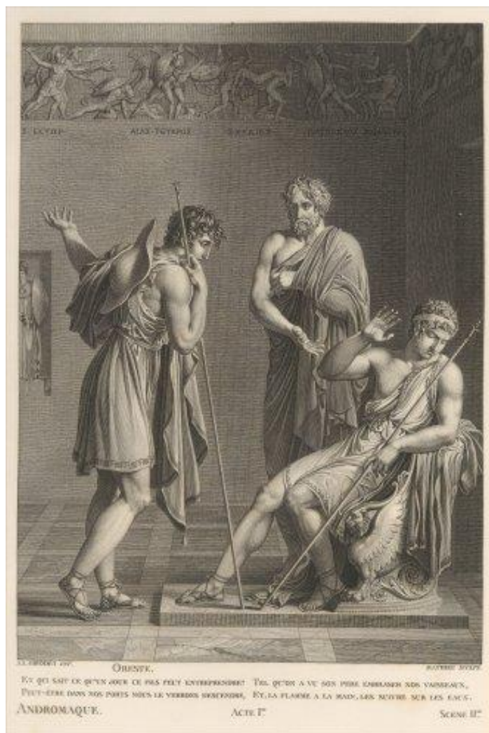
III. 2. Anne-Louis Girodet, Andromaque (acte I, scène 2), Œuvres de Jean Racine. Tome premier , Paris, de l'Imprimerie de Pierre Didot l'aîné, au Palais National des Sciences et des Arts, An IX [1801].

La description des éditions du Louvre dans le catalogue de cette vente en dit long sur le prix attaché aux gravures du Racine .