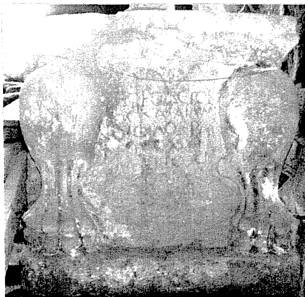
Fig. 1: L'inscription.

prouvent que ce nom, sans être fréquent, est bien attesté en Syrie 10 . En raison de la nature du support de la dédicace (voir infra ), on pourrait être tenté de mettre ce nom en rapport avec le culte d'Astarté assimilée à Aphrodite. La formule onomastique elle-même (οἱ suivi du patronyme au génitif) est plus rare, mais bien attestée, quand il s'agit de deux frères 11 .