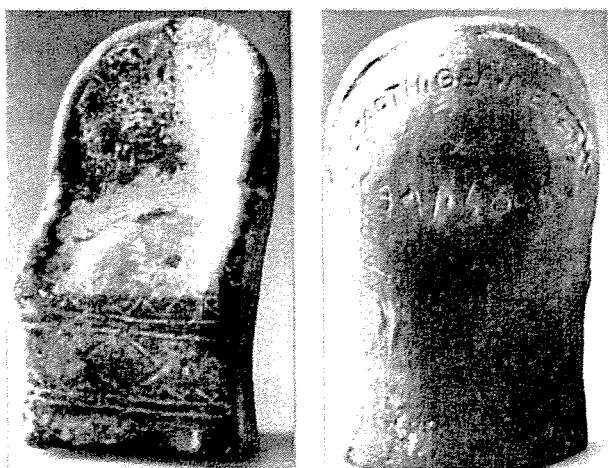
Figs 3 et 4: d'après Kunst und Handwerk der Antike (Auktion 14.2. Dezember 1983), Bâle, 1983, p. 31, n° 152.

De même, la dédicace, peut-être adressée à une divinité locale (Astarté, Adonis, la Baalat Gubal ?), utilise néanmoins un vocabulaire tout à fait banal en Grèce ou en Asie Mineure, prouvant une fois de plus l'intégration des cités de la côte phénicienne dans les différents courants culturels, religieux et artistiques du monde gréco-romain.