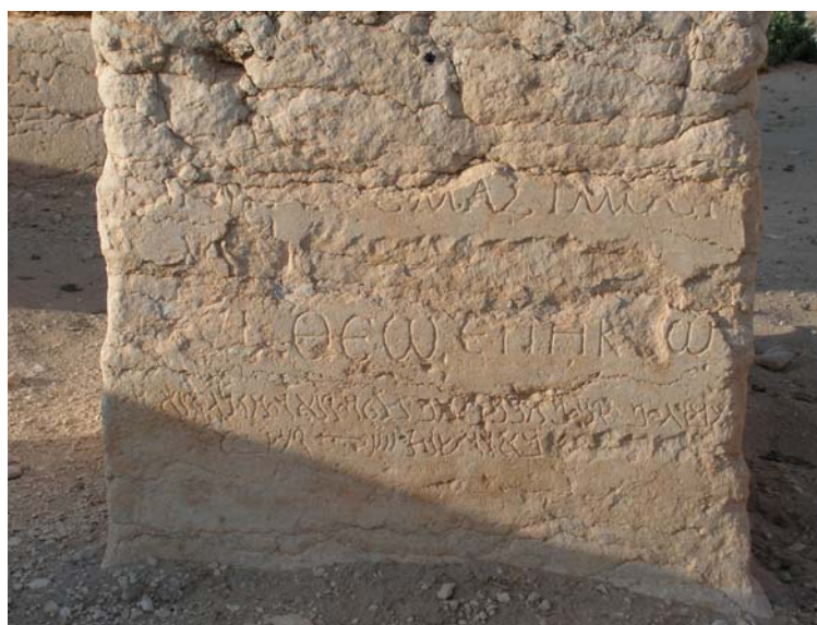
Fig. 2 : Inscription bilingue Inv XII , 33. Le centurion Iulius Maximus

On est sur un terrain plus solide avec le centurion Iulius Maximus, même si le nom et le numéro de la légion ne sont pas donnés dans une première inscription ( Inv X , 81 en 135 : ywlys mksms q̄tryn' dy lgywn' ; lacune du grec à cet endroit) et ont été martelés dans une seconde ( Inv XII , 33 ; fig. 2 ).