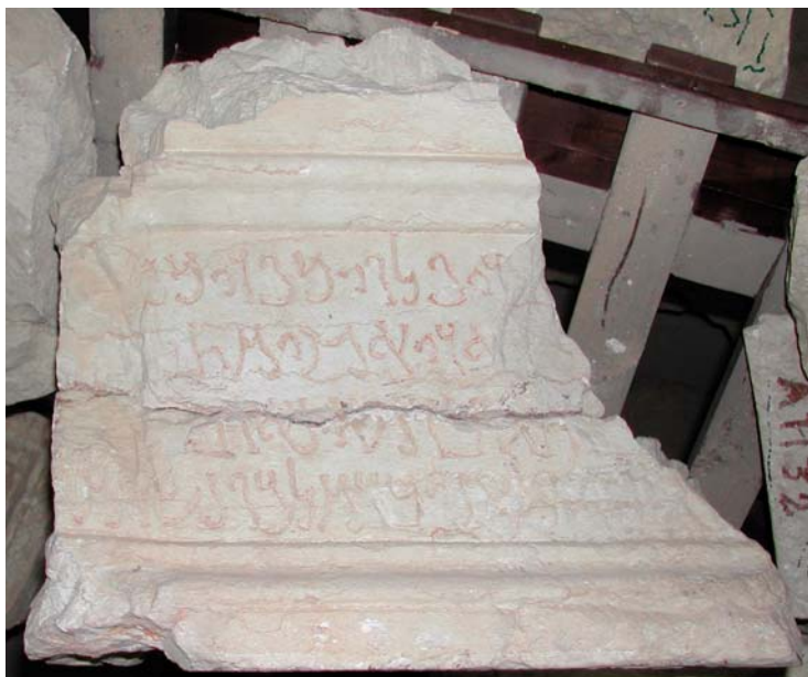
Fig. 5 : Inscription honorifique bilingue au Musée de Palmyre. Partie araméenne