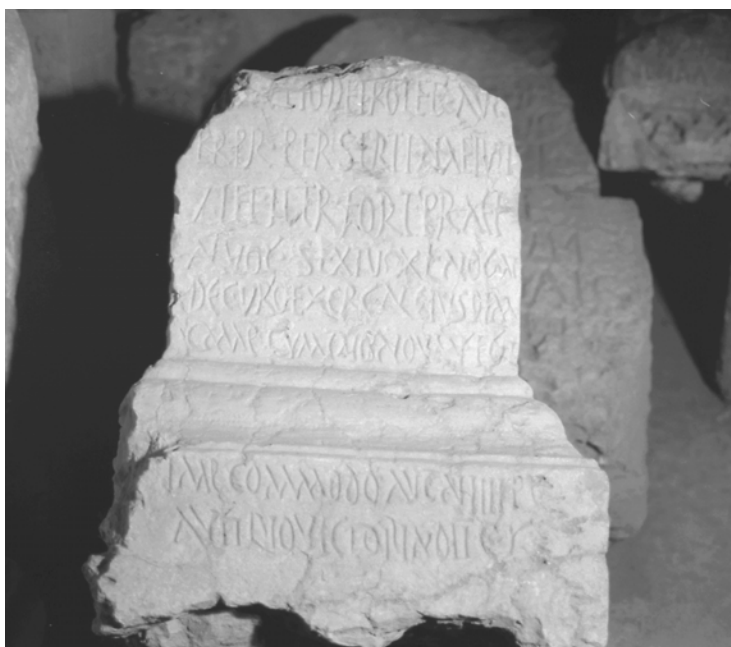
Fig. 1 : Inscription latine Seyrig 1933 : 164, n° 8 = AE 1933, 214. Une unité de Voconces à Palmyre

En 185, l' ala Thracum a quitté Palmyre et elle est attestée en Égypte à Coptos (SEG 6, 628). Dès 183, une inscription commémore la construction par une unité de Voconces d'un champ de manœuvre à Palmyre. La première lecture du nom de l'unité ( numerus Voc(ontiorum) ) a été contestée de manière convaincante par M.P. Speidel : il s'agit sans doute plutôt d'une unité connue depuis longtemps en Égypte et en Syrie, l' ala Vocontiorum . 18