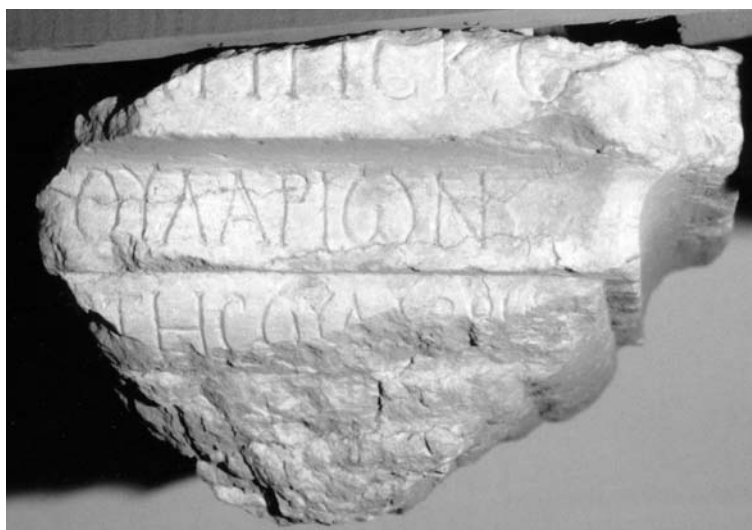
Fig. 6 : Inscription fragmentaire Bounni 2004 : 74, n° 44. Flavius Priscus

[ - - - Φ ] λ(άβιον) Πρίσκο[ v - - - ] [ - - σιν ] γουλαρίων vac [ - - - ] ΗΘΥΛΕΡΙ[ - - - ]