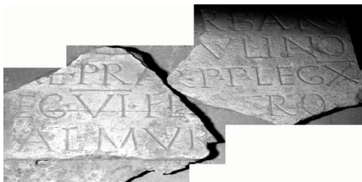
Fig. 3ab : Deux inscriptions latines fragmentaires inédites au Musée de Palmyre

[- - -Ba]rbaro [- - -]Iuliano [- - -]R . p(rimo) p(ilo) leg(ionis) X 4 [Fretensis- - -]TROfeuille