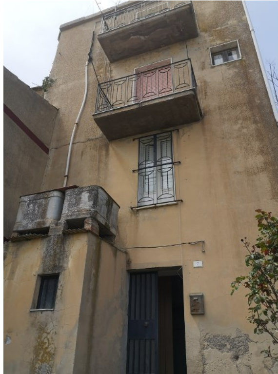
Figura 8. “Casa sul vicolo Italia”.

Quello che è evidente è il target di riferimento: acquirenti preferibilmente stranieri, un’élite cosmopolita giudicata desiderabile nelle gerarchie migratorie globali non molto distante dal target delle politiche fiscali vantaggiose che mirano ad attirare i “visti dorati”, come evidenziato nel caso di Lisbona da Montezuma e McGarrigle (2019), e in modo specifico i pensionati, nell’ambito di quella che è stata definita l’ international retirement migration (Iorio, 2020) 16 .