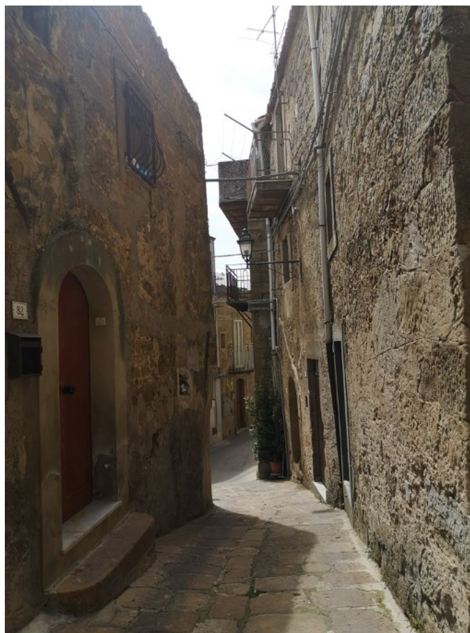
Figura 4. Un vicolo del centro storico.