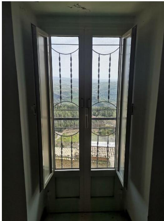
Figura 7. La vista dalla “Casa sul Vicolo Italia”.