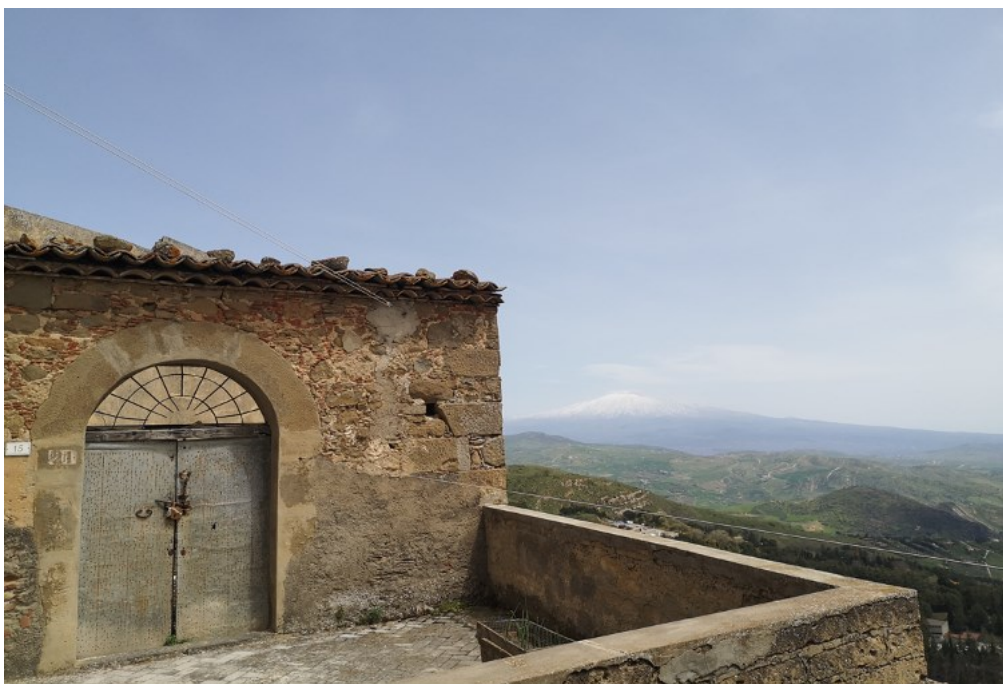
Figura 2. Uno scorcio di Troina, l’Etna sullo sfondo.

Nel corso degli ultimi anni la governance locale 10 ha avviato una serie di interventi mobilitando un repertorio variegato di finanziamenti nazionali ed europei, stanziando fondi per nuove attività imprenditoriali e per l’acquisto di un immobile per 60 giovani coppie in centro storico, oltre all’allestimento di un museo dedicato al fotoreporter Robert Capa e diversi percorsi ecoturistici, che hanno valso il riconoscimento nel 2019 di “Borgo più bello d’Italia” 11 .