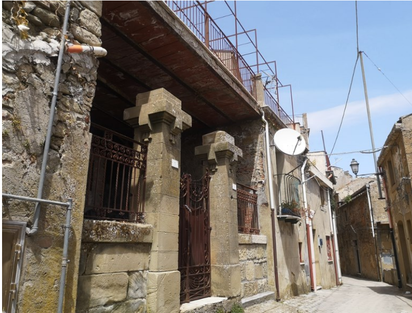
Figura 6. Villa Elena, una delle case a un euro.