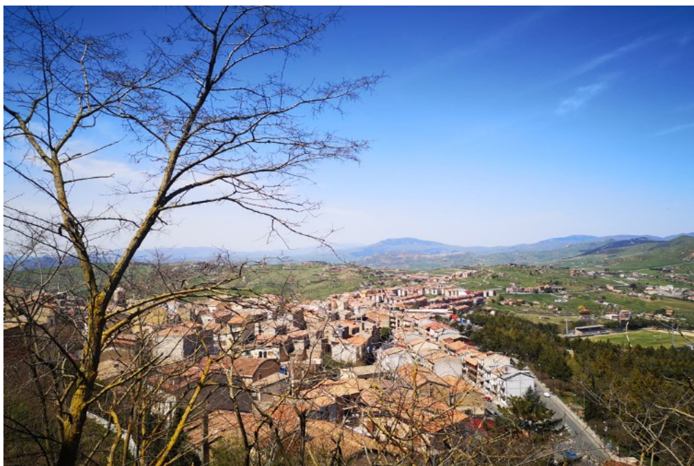
Figura 3. I quartieri di nuova costruzione.

In questo contesto si inserisce l’iniziativa C1E, lanciata ufficialmente nel 2014 ma effettivamente operativa a partire dal 2021 con la costituzione di una startup ( www.housetroina.it ) che, nel portale ufficiale, dichiara di “promuovere investimenti stranieri, e non, nel nostro territorio”. Anche a Troina il ruolo della stampa internazionale è decisivo: dopo un servizio della CNN nel 2021 il portale riceve più di 16.000 richieste di informazioni. A fronte di questa attrattiva mediatica, a fine 2022 solo 4 transazioni immobiliari si sono concluse, di cui due a un euro e altre due del mercato immobiliare “tradizionale”, a cui però gli acquirenti sono approdati passando attraverso la piattaforma.