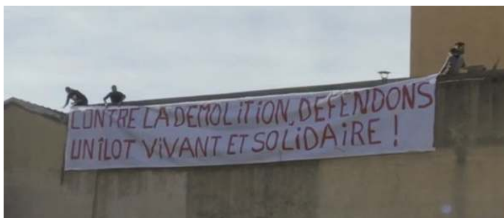
Fig. 6 : Déploiement d'une banderole sur l'îlot Mazagran.