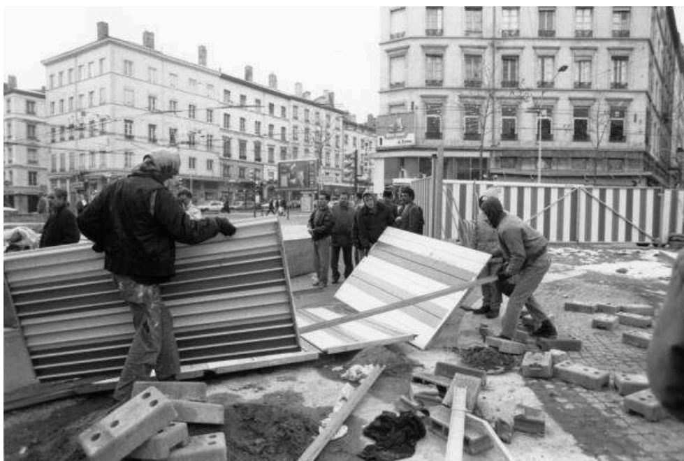
Fig. 1 : Manifestation des opposants à la construction du CLIP