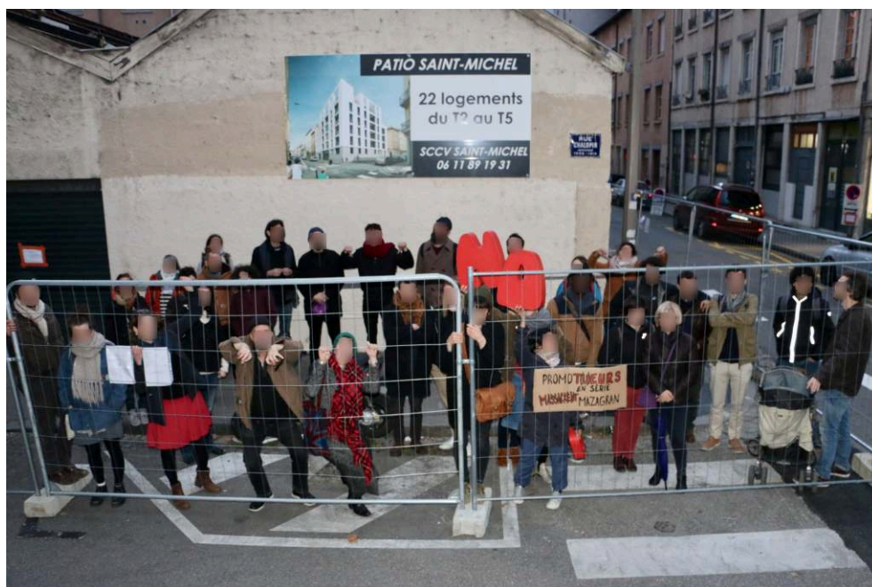
Fig. 4 : Manifestation organisée en mars 2019 par Habitons Mazagran pour dénoncer la destruction d'un garage et la construction d'un immeuble de logements.