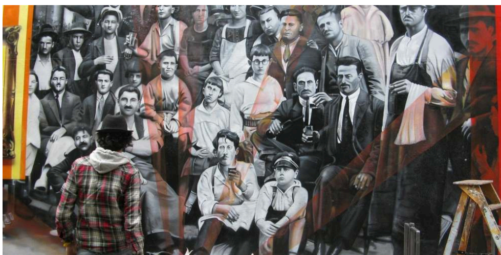
Fig. 2 : L'ancienne fresque du street-artist brésilien Eduardo Kobra, aujourd'hui disparue et qui se trouvait place Mazagran, illustrant le rôle de l'immigration à la Guillotière.