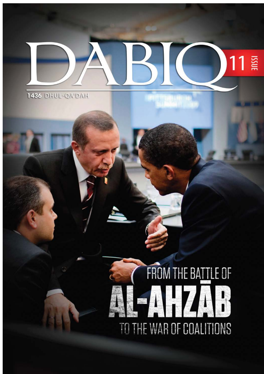
Figure 3. Couverture du 11 e numéro du magazine Dābiq