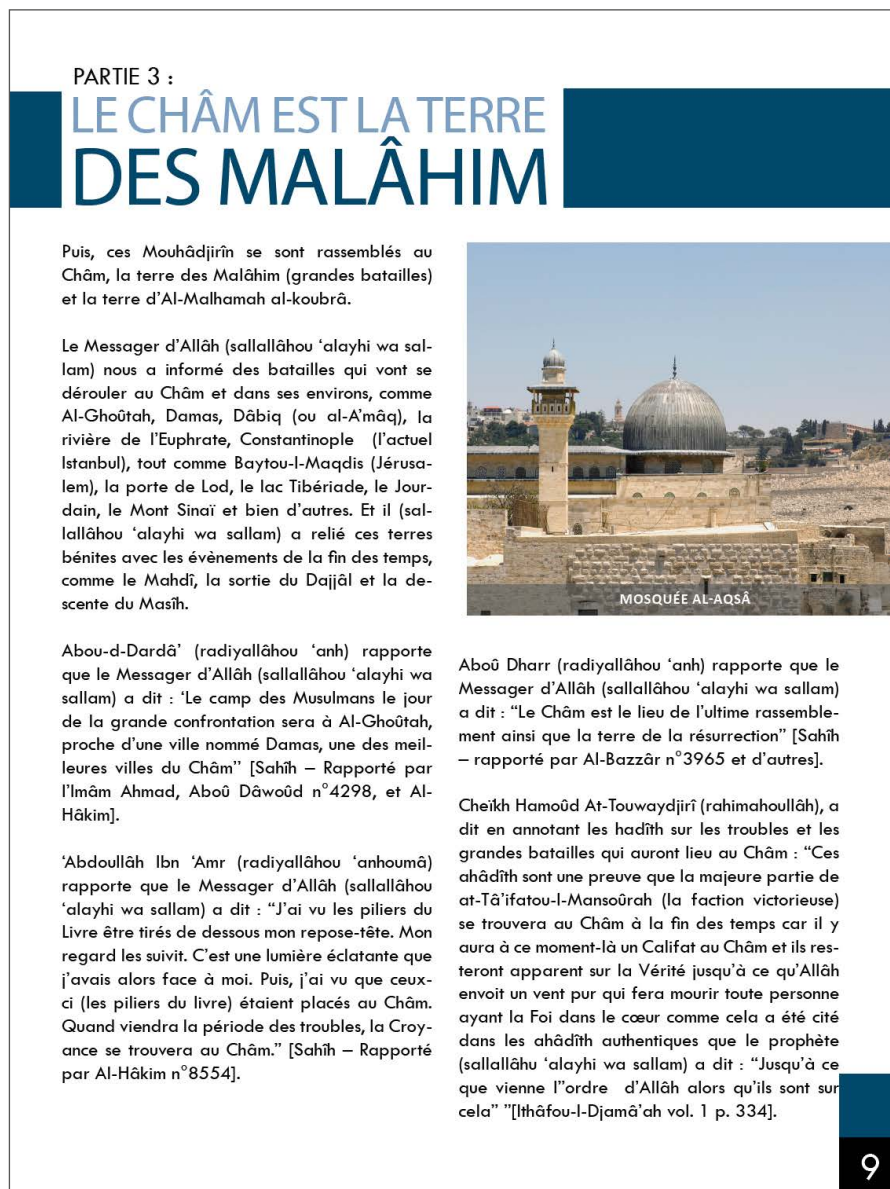
Figure 1. Page 9 du 3 e numéro du magazine Dâbiq