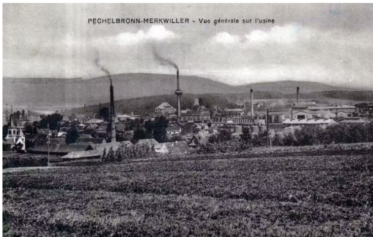
Carte postale ancienne de l'exploitation de pétrole de Pechelbronn. Domaine public, CC BY

Il faut cependant attendre le XX e siècle et le cadre du code minier renouvelé de 1956 pour que l'essentiel de l'activité d'exploration et d'exploitation des hydrocarbures en France soit développé. La Seconde Guerre mondiale a mis en lumière la dépendance française en pétrole et il s'agit pour la France de sécuriser ses approvisionnements dans une filière dominée par les entreprises américaines, anglaises et hollandaises. C'est le service de conservation des gisements d'hydrocarbures qui organise alors le suivi et le contrôle de l'activité pétrolière sur le territoire mais aussi les activités des sociétés pétrolières françaises à l'étranger notamment dans les colonies africaines. Au-delà de la seule exploitation sur le sol national, la particularité de la filière française est d'avoir su développer une expertise et une industrie parapétrolière sans commune mesure avec les volumes extraits sur le sol national. Les entreprises Schlumberger et Technip par exemple fournissent des outils de prospection, d'ingénierie et de forage.