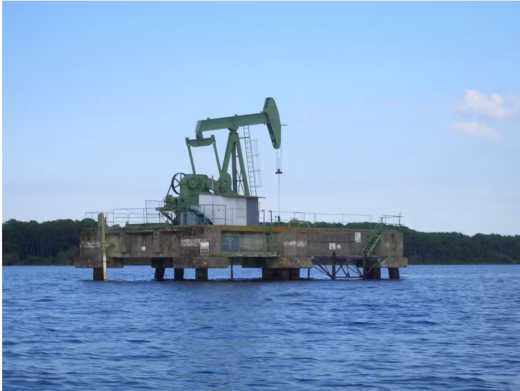
Station de pompage lac de Parentis.