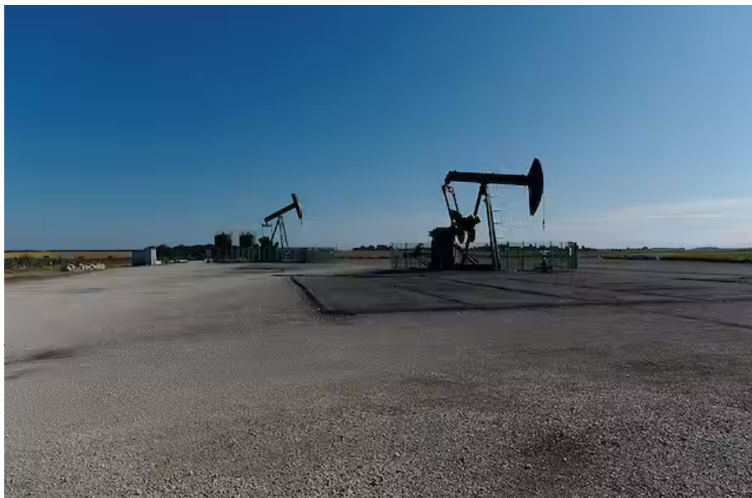
Chevalets de pompage de pétrole a Jouy-le-Châtel