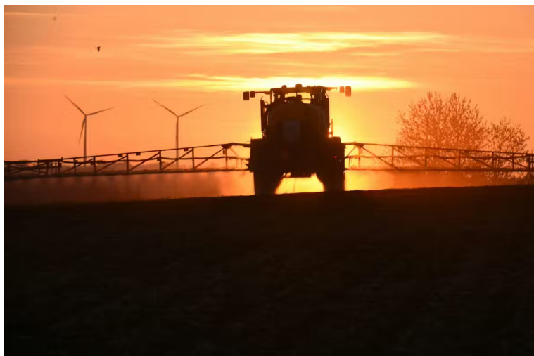
Un agriculteur en train d'épandre du Roundup.

Le NoDU correspond ainsi au cumul des surfaces (en hectares) qui seraient traitées à ces doses de référence. Cette surface théorique est supérieure à la surface agricole française, puisque les cultures sont généralement traitées plusieurs fois.