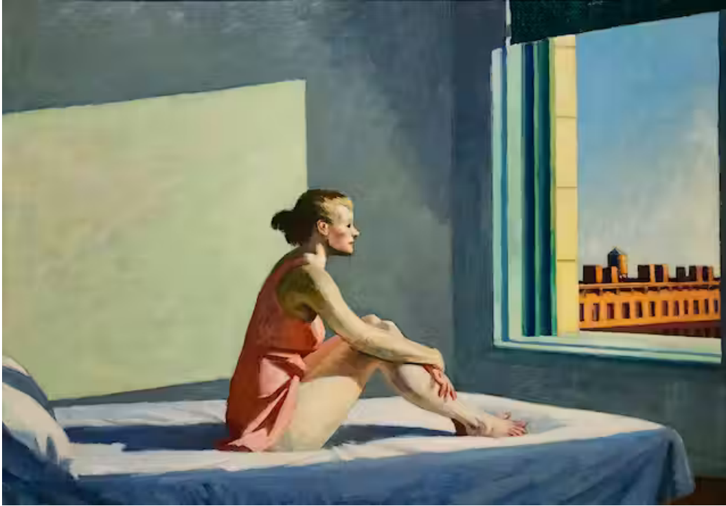
Edward Hopper, Soleil du matin (1952). Wikipédia