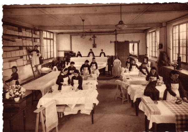
La buanderie du Bon Pasteur d'Orléans, dans les années 1950.

Dans ce contexte, les Bon Pasteur tentent de moderniser leur image. Le cliché insiste donc sur la formation professionnelle proposée aux pensionnaires, quand d'autres photographies mettent en scène les ateliers de repassage, de couture, de puériculture.