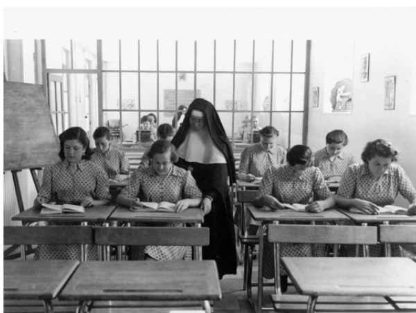
Livret de présentation de l'ordre du Bon Pasteur, années 1950.

La photographie n° 2 est issue d'une collection produite par la congrégation du Bon Pasteur. Elle a été prise au cœur des années 1950 dans un établissement non précisé de la congrégation, il peut s'agir de Charenton-le-Pont, ou peut-être à Pau, Orléans, Marseille... Elle figure dans un des livrets de présentation de l'ordre, qui se présente comme un petit fascicule de plusieurs pages, illustré d'autres photographies. Ces livrets ont pour vocation de valoriser l'action éducative de l'œuvre et sont distribués tant aux parents, qu'aux partenaires ou aux généreux donateurs.