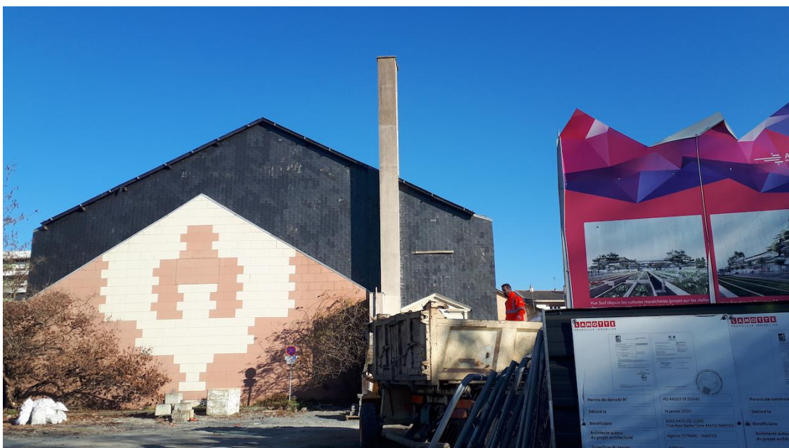
Photographie 3 : ancienne salle de sports Bessonneau avec permis de démolir et visuel du futur projet « Imagine Angers »

Enfin il semble intéressant de se pencher sur le sort de la dernière usine située en plein centre-ville d'Angers : l'ancienne distillerie des usines Cointreau, fleuron mondialement connu de l'industrie des liqueurs. Cette usine dite des Luisettes fut installée dès le XIX e siècle, place Molière, en bord de Maine. Le bâtiment fera l'objet de nombreuses transformations et extensions, entre 1857 pour les premières pierres et 1959. L'immeuble tel qu'il se présente aujourd'hui, en béton et appareillage de briques, résulte principalement de plusieurs phases de construction entre 1936 et 1959 23 , inscrivant l'édifice existant dans le champ d'une architecture industrielle moderne de l'entre-deux guerres. S'il n'est pas inscrit par l'État à l'inventaire des Monuments historiques, l'usine Cointreau des Luisettes se trouve identifiée dans l'annexe Patrimoine du PLUi d'Angers Loire Métropole et bénéficie par conséquent d'un certain niveau de protection accordé par les effets de l'article L. 151-19 du code de l'urbanisme et le règlement contenant l'inventaire patrimonial. Cette usine s'avère être le seul élément de patrimoine industriel relevé par le document d'urbanisme pour toute la ville d'Angers. Pour autant, cette relative protection ne sanctuarise nullement l'immeuble, au point que le bâtiment fait actuellement l'objet d'un important projet de rénovation (Photographie 4), porté par le Crédit Mutuel propriétaire des lieux depuis 1972 et qui y a fait son siège départemental.