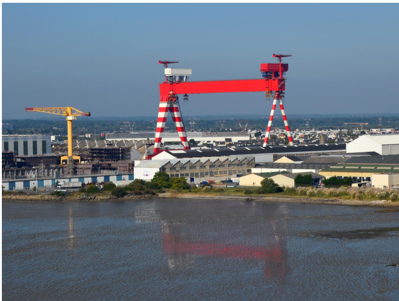
Photographie 2 : Le très grand portique sur les chantiers navals de Saint-Nazaire