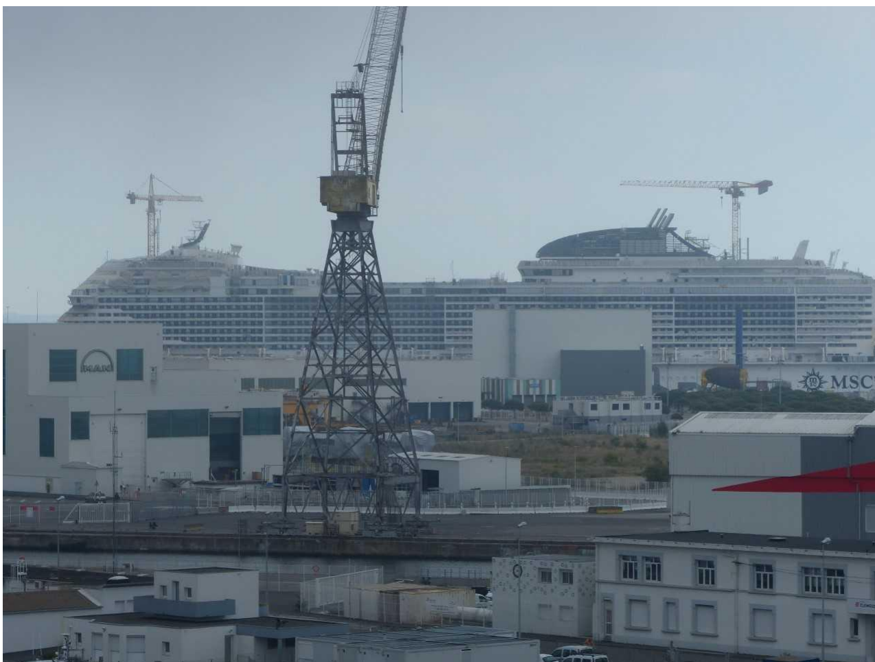
Photographie 1 : Le site industrialo-portuaire de Saint-Nazaire et l'importance des chantiers navals

Le PLUi de l'agglomération de Saint-Nazaire identifie, parmi dix entités paysagères, une séquence paysagère intitulée « la Loire monumentale » qui « désigne les paysages industriels ligériens en continuité de la côte urbanisée dont ils se distinguent par un adressage double sur le front littoral et estuarien ainsi que par l'urbanisation XXL des équipements portuaires et industriels » 6 . Le PLUi identifie ainsi des verticalités repères, formes de marqueurs paysagers, comme le « très grand portique STX » ou les « grues Mohr » (Photographie 2). Il ne fait donc pas l'impasse sur l'industrie, omniprésente dans le paysage nazairien. Au contraire, il la monumentalise en la qualifiant tantôt « d'emblématique », tantôt de « monument industriel de la Loire ». Le patrimoine industriel nazairien n'est donc pas protégé factuellement mais il est valorisé dans les documents de planification territoriale (notamment au travers de circuits touristiques) ainsi que dans le label Ville d'art et d'histoire récemment obtenu par la ville.