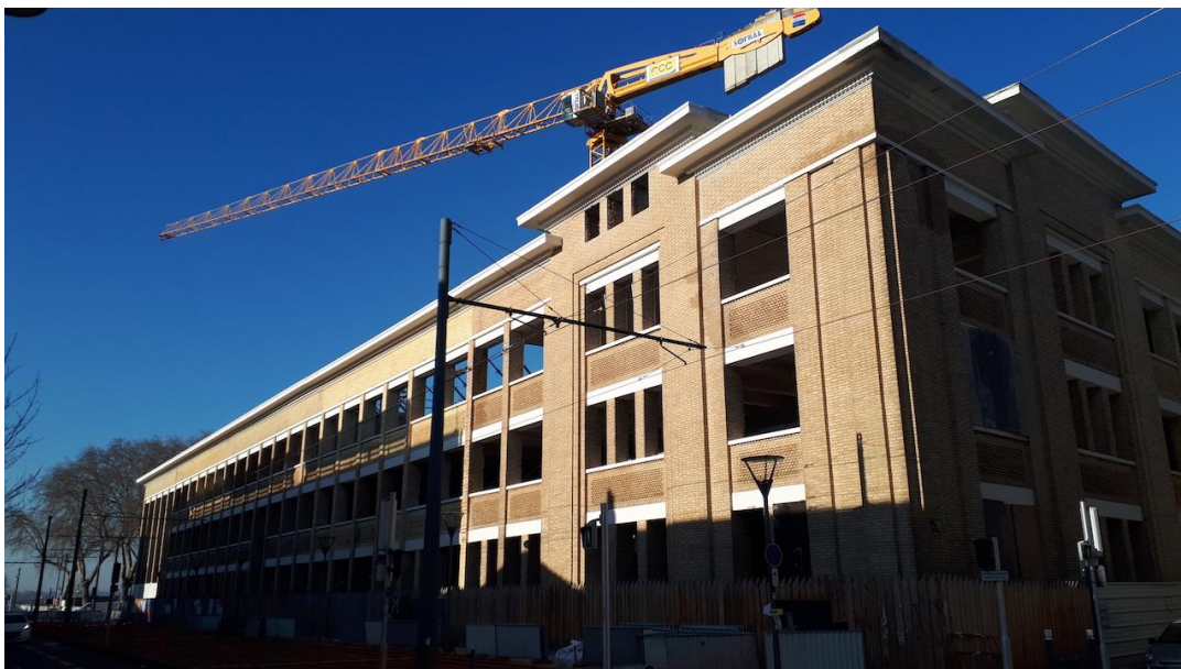
Photographie 4 : ancienne usine Cointreau des Luisettes en pleine transformation avec surélévation sur 3 niveaux

Si les éléments intérieurs seront préservés (et même en partie restaurés – grand escalier, rotonde et salle des alambics), tout comme en extérieur les façades en brique, le bâtiment sera quand même surélevé sur trois niveaux en architecture bois, comprenant quarante appartements de standing (de 65 à 200 m 2 , vendus jusqu'à 1,4 million d'euros). Le toit accueillera par ailleurs un roof top avec espace de restauration permettant d'admirer les vues sur le paysage urbain historique de la ville : la cité et le château d'Angers en skyline . Ainsi se poursuit la vie d'une usine, fut un temps emplie d'ouvriers, et dont la transformation oublie de rappeler ce passé pour seulement donner à voir du haut des appartements de standing le seul patrimoine dont s'honore la ville... L'analyse de Vincent Veschambre résonne encore fermement aujourd'hui : « alors que les groupes sociaux dominants peuvent matérialiser leur position sociale dans les espaces les plus prestigieux, les groupes dominés ne laissent que peu de traces patrimonialisables, c'est-à-dire foncièrement valorisantes » (Veschambre, 2002, p. 70).