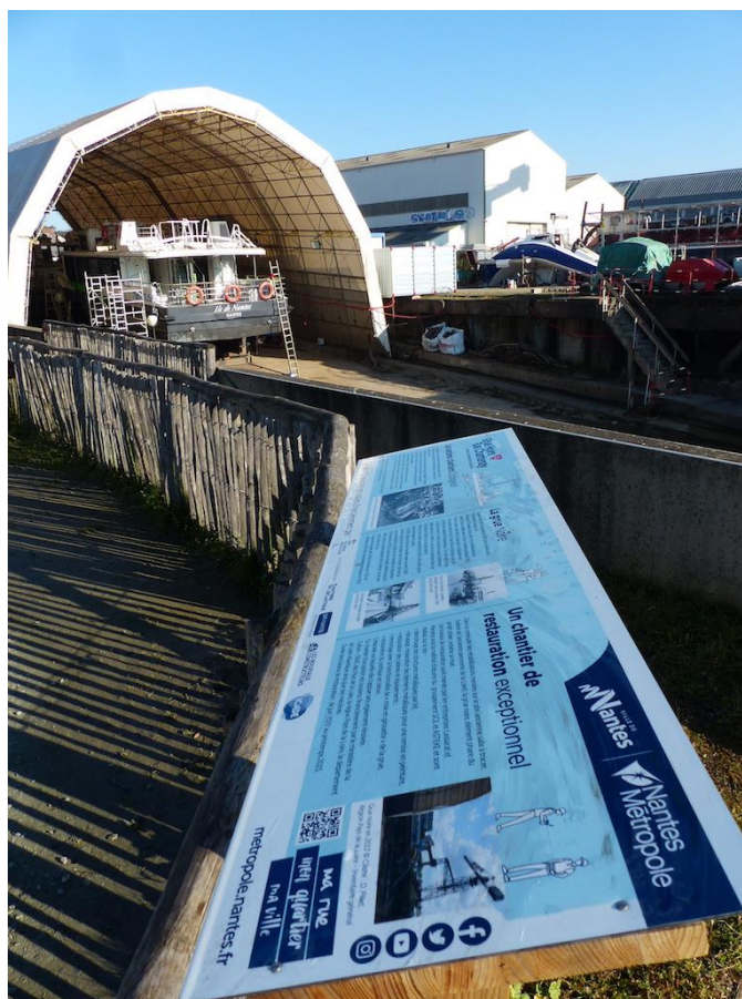
Photographie 5 : Cale des chantiers navals Dubigeon, dans le quartier du bas Chantenay, avec panneau d'information sur les patrimoines industriels

Sur l'une des cales, celle du chantier de l'Esclain, viendront s'arrêter les navettes fluviales prévues parmi les mobilités reliant ce quartier à la ville. L'imposante usine électrique, typique par ses briques rouges, accueillera quant à elle un nouveau pôle industriel dédié au nautisme et aux énergies marines. Comme l'exprime l'architecte Bernard Reichein, dont l'agence a été missionnée par Nantes Métropole pour le plan guide du Bas Chantenay, « il y a une grande nécessité de protéger ce patrimoine et de (ré)insérer dans le projet les patrimoines de l'industrie qui marquent ce territoire. Je pense que le lieu de la mémoire est un élément important ». Une mémoire conservée non seulement par un paysage industriel urbain formant la skyline des bords de Loire et dont la grue noire monument historique représente un nouveau « totem » (Veschambre, 2014) esthétisant de la ville, mais aussi une mémoire de l'histoire industrielle vivante par le maintien ou le retour d'activités industrielles (mais pas seulement) dans les immeubles patrimonialisés.