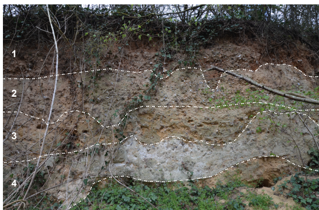
Vallée de l'Eure, fig. 2 : Guainville, le Silo : coupe dans les alluvions de la moyenne terrasse, sur 4 m de hauteur. 1. sables rubéfiés avec marques de cryoturbation ; 2. sables fins à galets de silex ; 3. sables fins ; 4. formations tufacées ; 5. sables très limoneux. Non visibles sur la photographie, les unités 6 (sables grossiers) et 7 (alluvions grossières avec galets de silex) ont été observées sur le terrain (L. Yacine).

versant, une étude détaillée des terrasses fluviales au niveau de la moyenne vallée de l'Eure a été conduite et a permis de mettre en évidence le potentiel géochronologique de la moyenne terrasse de Guainville. Accessible en coupe dans une ancienne gravière, cette terrasse montre une succession remarquable d'anciennes alluvions de l'Eure, près de la confluence avec le Radon. Dans cette coupe, la présence de sables