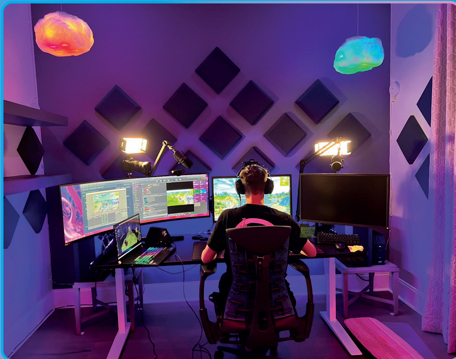
Ninja. Habitación de streaming en 2022.