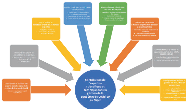
Figure 1 : représentation de l'arbre thématique

Le thème principal qui fédère les sous-thèmes concerne la contribution de l'expertise scientifique et technique dans la gestion de la pandémie du Covid-19. En effet, un ensemble de sous-thèmes (développés dans les paragraphes qui suivent), ayant émergés des analyses, permettent de caractériser la diversité des figures d'experts, leurs rôles, la place de leurs expertises ainsi que leurs contributions dans la gestion de la crise du Covid-19 au Niger. La schématisation suivante présente l'ensemble des thèmes et sous thèmes.