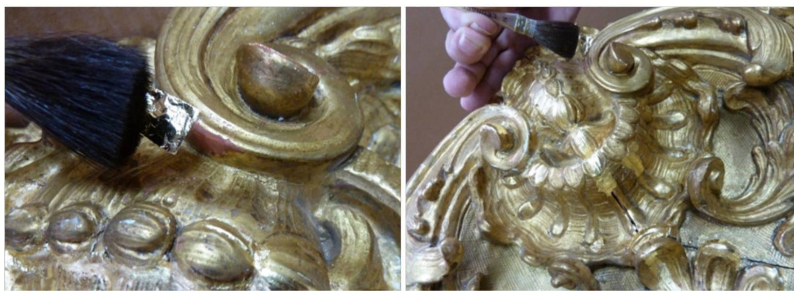
Légende - ©Crédit - Helvetica neue Light 10 pt

La redorure traditionnelle du bois ne répond pas aux principes de la conservation-restauration dans la mesure où la pose de nouvelles feuilles d'or, avec le même matériau que celui d'origine, constitue un acte intrusif et irréversible. L'usure des surfaces est aujourd'hui mieux acceptée et souvent traitée avec des substituts de l'or tels que les micas ou les aquarelles. Mais il est des cas où la redorure à la feuille d'or est nécessaire, d'où l'objectif de ce projet : mettre au point des alliages spécifiques pour la restauration, en intégrant un marqueur qui permette de distinguer redorure et or ancien.