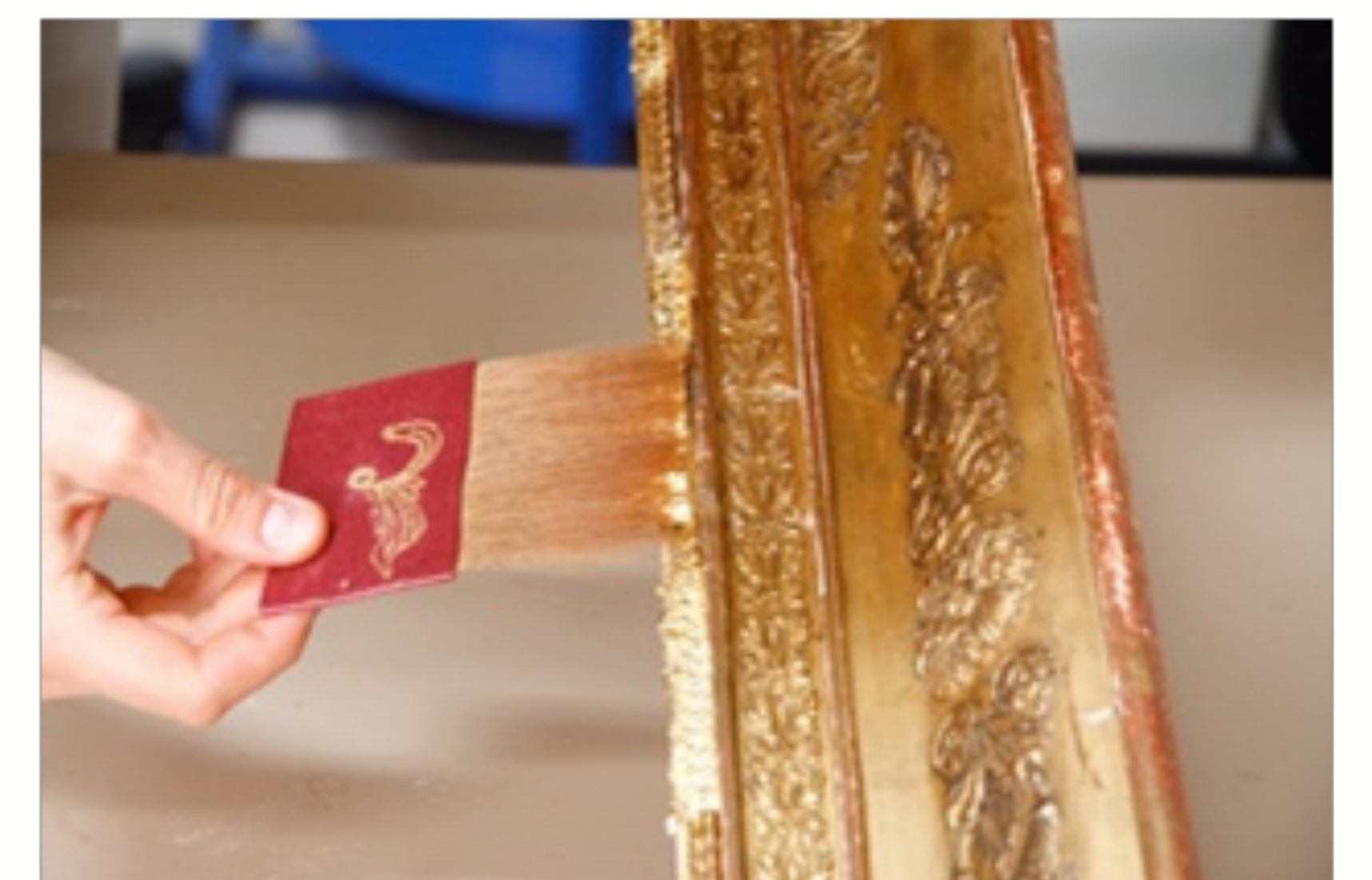
Légende - ©Crédit - Helvetica neue Light 10 pt