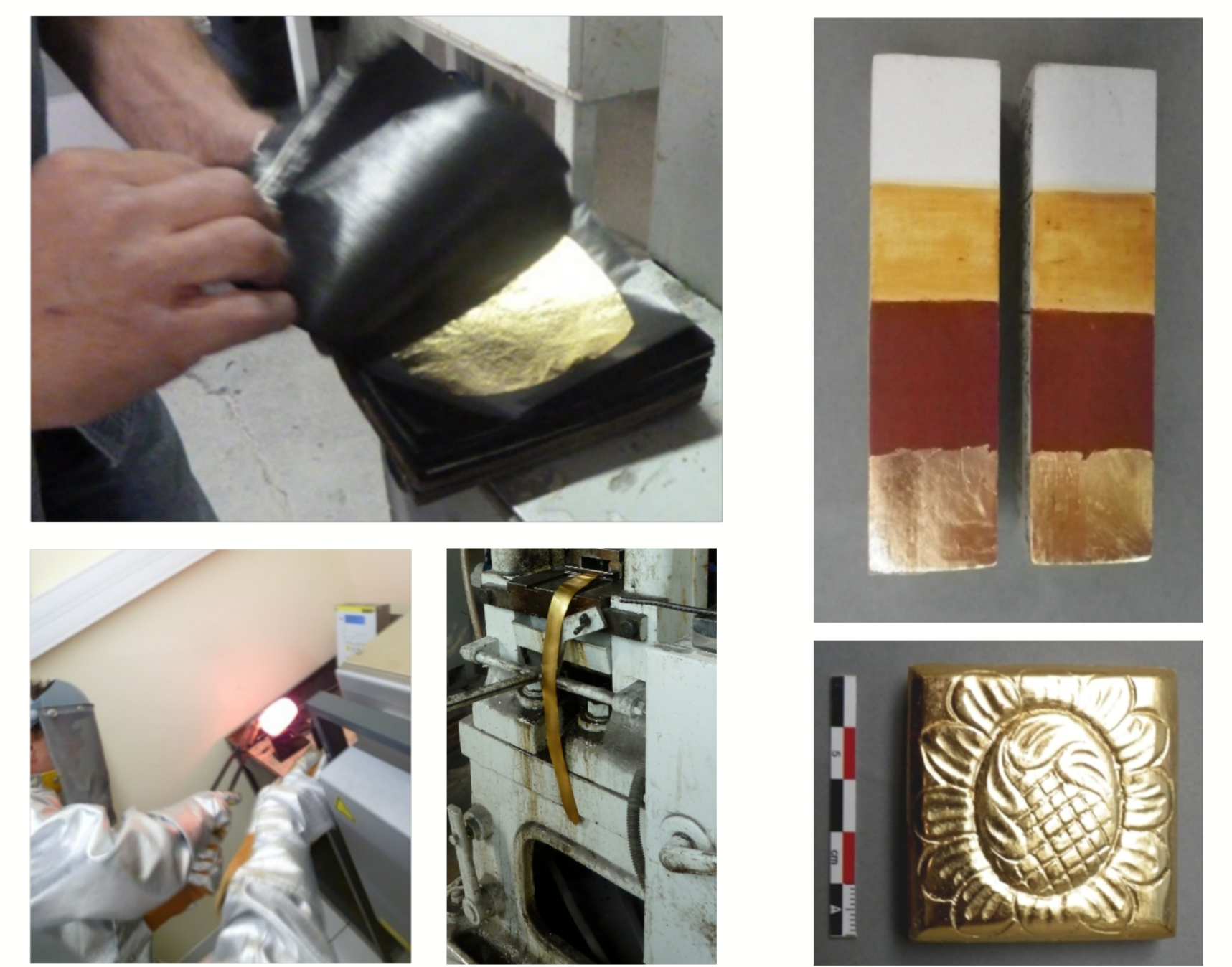
Légende - ©Crédit - Helvetica neue Light 10 pt

Les alliages ont été réalisés au C2RMF, après plusieurs refontes. Les analyses effectuées avec l'accélérateur de particules AGLAE et en fluorescence X ont montré que les teneurs en indium étaient restées stables et homogènes. Ces lingots ont été confiés aux établissements de battage d'or Dauvet, partenaire du projet, pour réaliser les feuilles. Ces dernières, après validation analytique, ont fait l'objet de tests d'application sur des éprouvettes par l'atelier dorure du C2RMF. Ceux-ci ont montré qu'il n'y avait pas de différence, en termes de couleur, d'éclat et de mise en œuvre avec les feuilles traditionnelles.