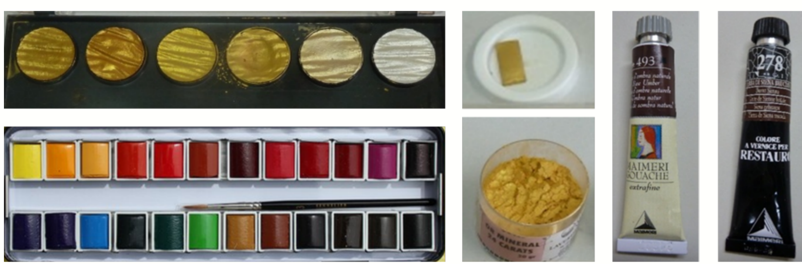
Légende - ©Crédit - Helvetica neue Light 10 pt