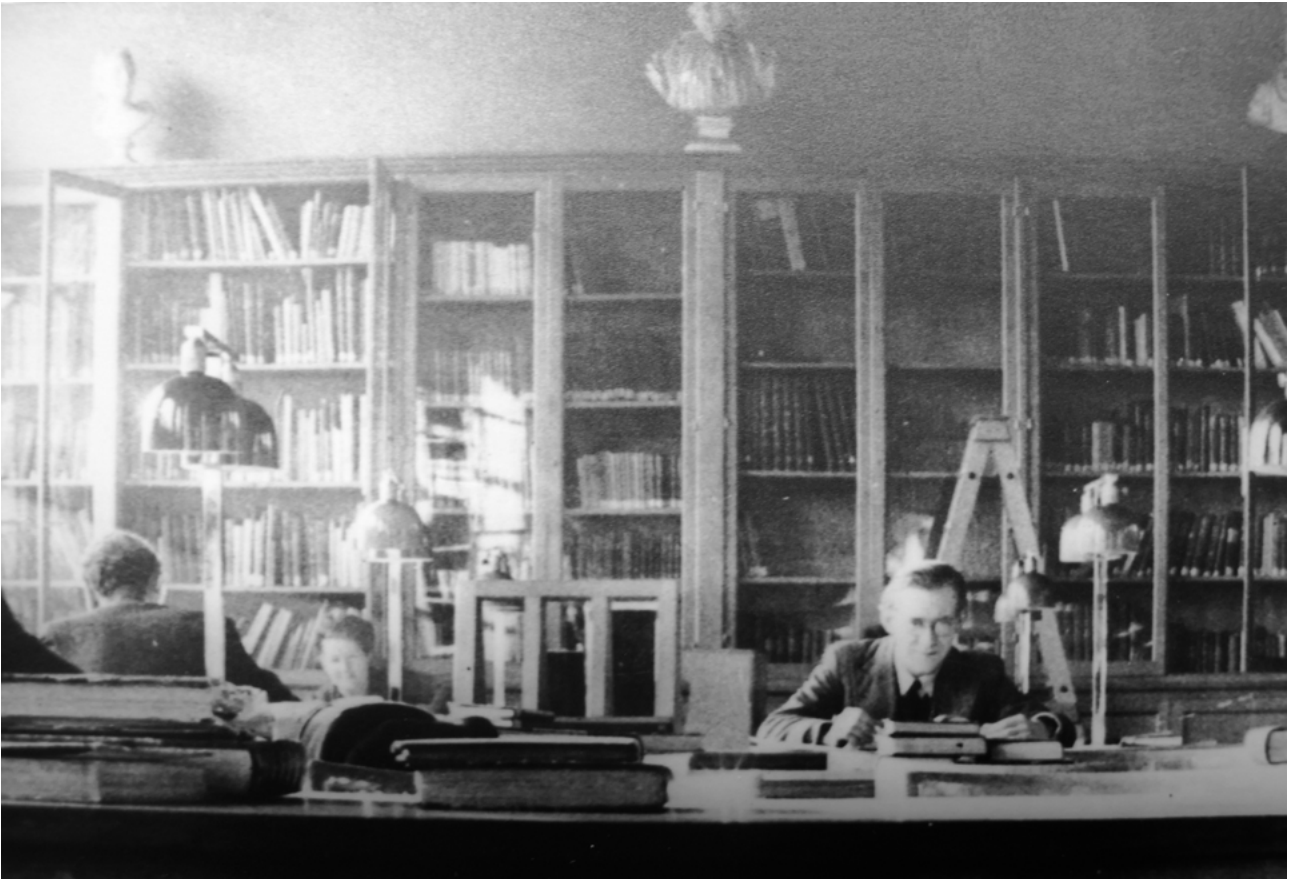
Fig. 1 : Louis Grodecki à l'Institut d'art et d'archéologie de la rue Michelet, Paris, bibliothèque de l'INHA, Archives 020/25/54

tels que l'art carolingien, la peinture murale en Occident du XII e au XIV e siècle, l'art du portrait, la trajectoire artistique de Jean Fouquet ou encore l'architecture et la sculpture en France à la fin du Moyen Âge 13 .