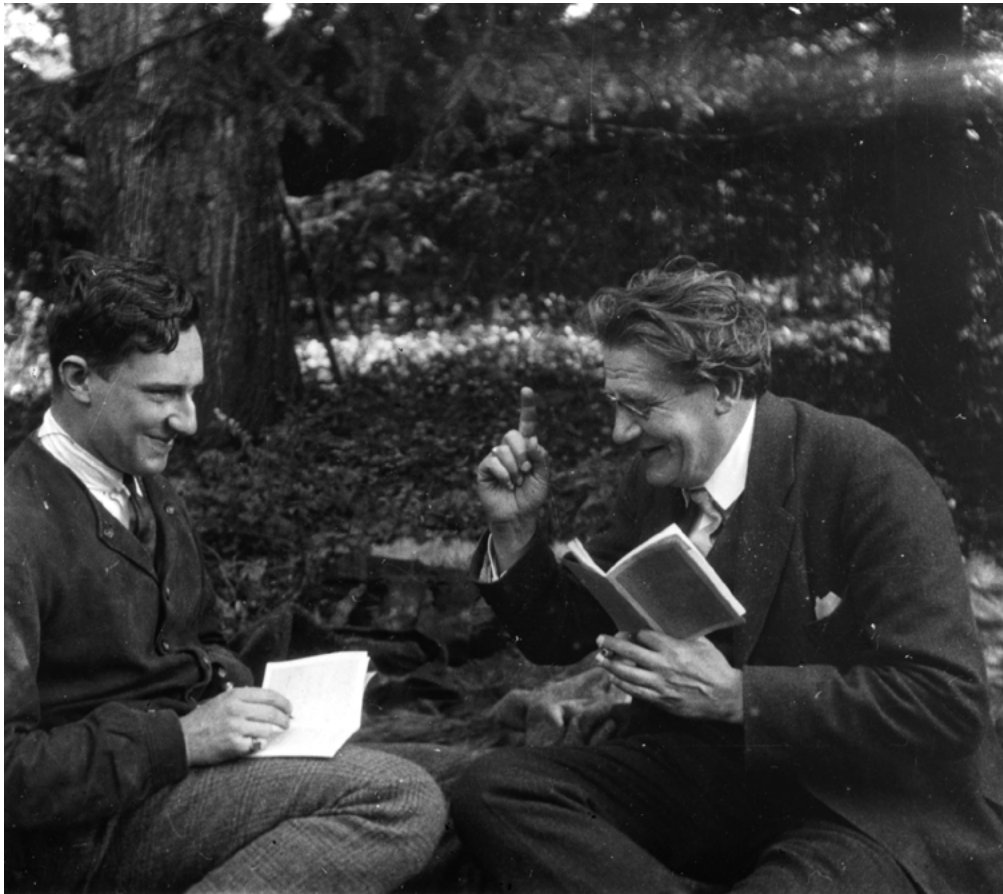
Fig. 2 : Hans Robert Hahnloser et Julius von Schlosser, fin des années 1920, Institut d'histoire de l'art, Université de Berne

en 1926 et il la publia en 1935 5 . C'était un chercheur qui se basait sur l'observation de l'œuvre elle-même, en y concentrant toute son attention, et qui, dans la mesure du possible, justifiait ses conclusions par les sources écrites. En 1934, il fut nommé à la chaire d'histoire de l'art de l'université de Berne 6 ; et puisque, à cette époque, voyager en Europe devenait de plus en plus difficile, voire impossible, Hahnloser s'engagea dans la Société d'histoire de l'art en Suisse, société qui publie les Monuments d'art et d'histoire de la Suisse , autrement dit l'Inventaire, et ce encore de nos jours 7 . En 1935, il devint membre de son comité de rédaction ; ensuite, de 1957 à 1966, il assura la présidence de la société. Durant son mandat, il fut responsable de la rédaction et de la révision des directives destinées aux auteurs des volumes de l'Inventaire (éditions de 1944 et de 1965).