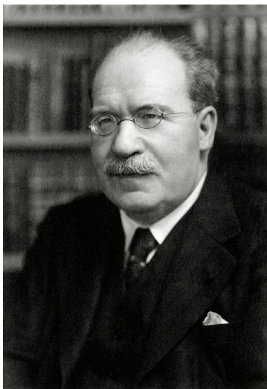
Fig. 1 : Henri Focillon