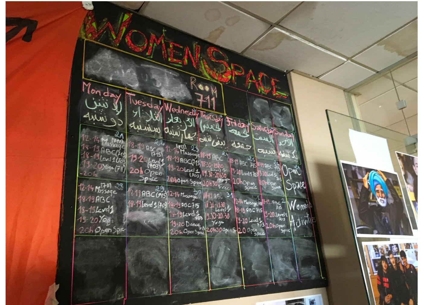
City Plaza (Athènes).

En féminisant le regard sur les migrations, nous marchons sur une ligne de crête, celle de la naturalisation, du renvoi des femmes à une nature féminine, seule et unique. Or, « la femme migrante » n'existe pas. J'ai eu l'occasion d'enquêter sur des formes de migrations féminines très différentes : commerçantes à la valise tunisiennes circulant de part et d'autre de